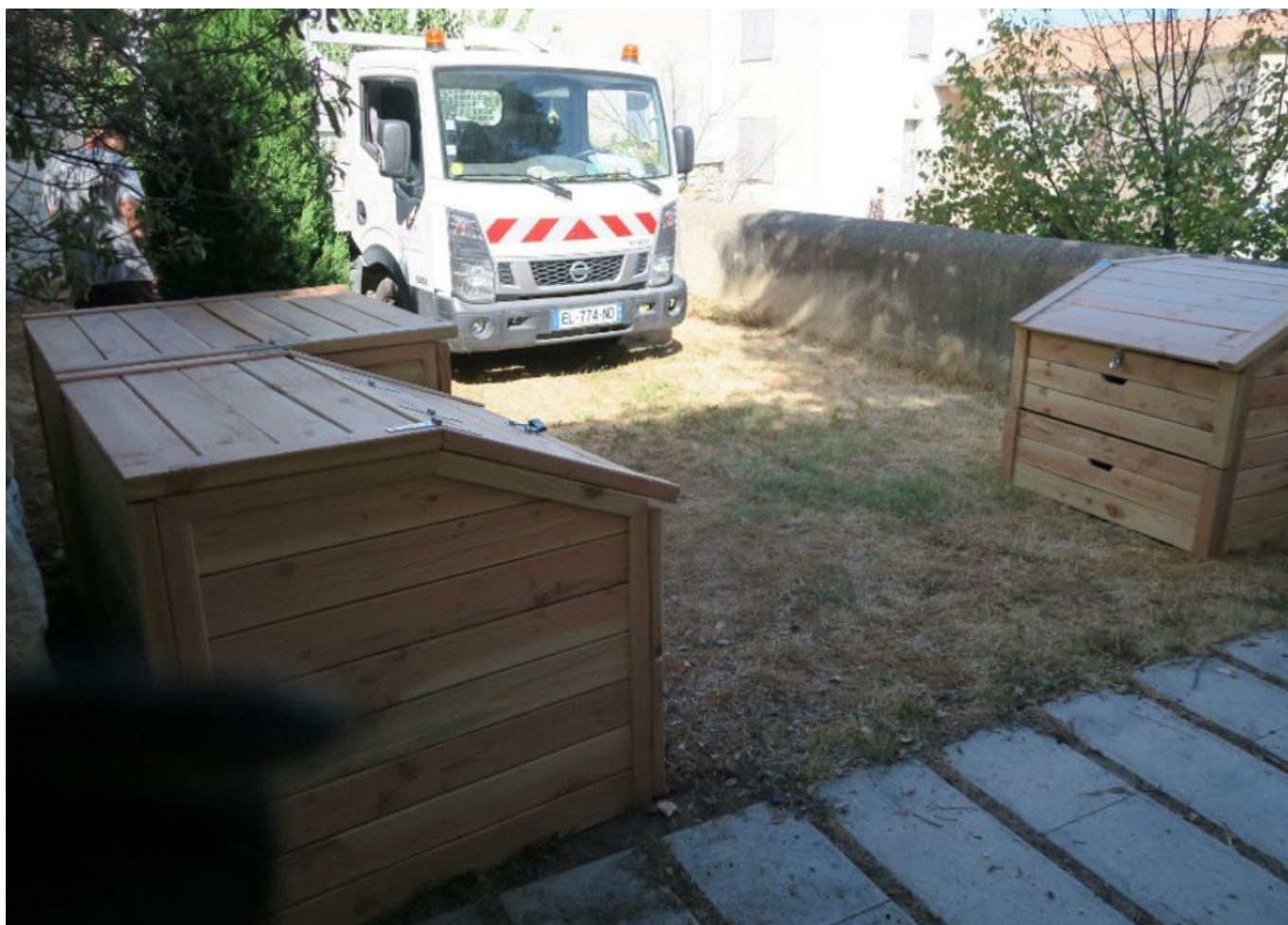
Site de compostage partagé rue de saillon