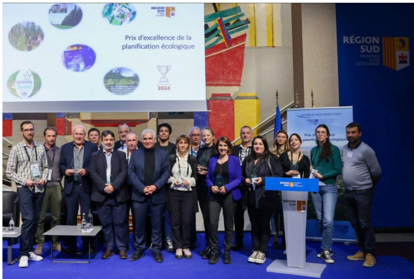
L'ensemble des lauréats de la 2 e édition du Prix d'excellence de la planification écologique de la Région Sud.