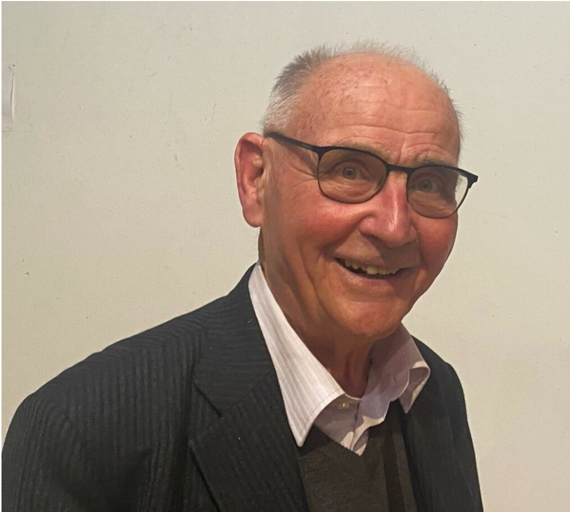
René Moulinas