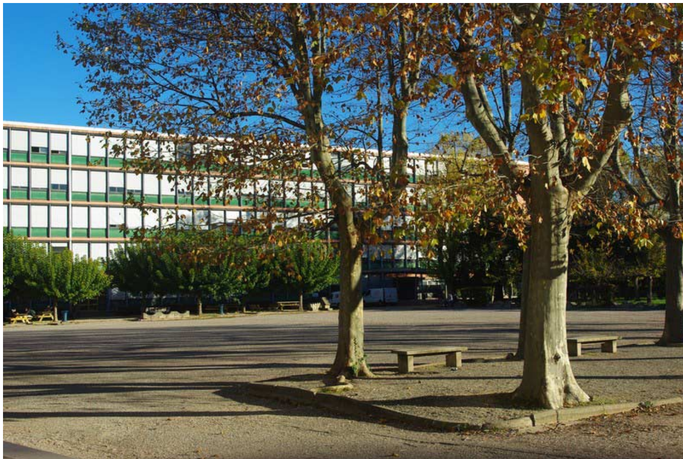
Le lycée Philippe de Girard à Avignon.