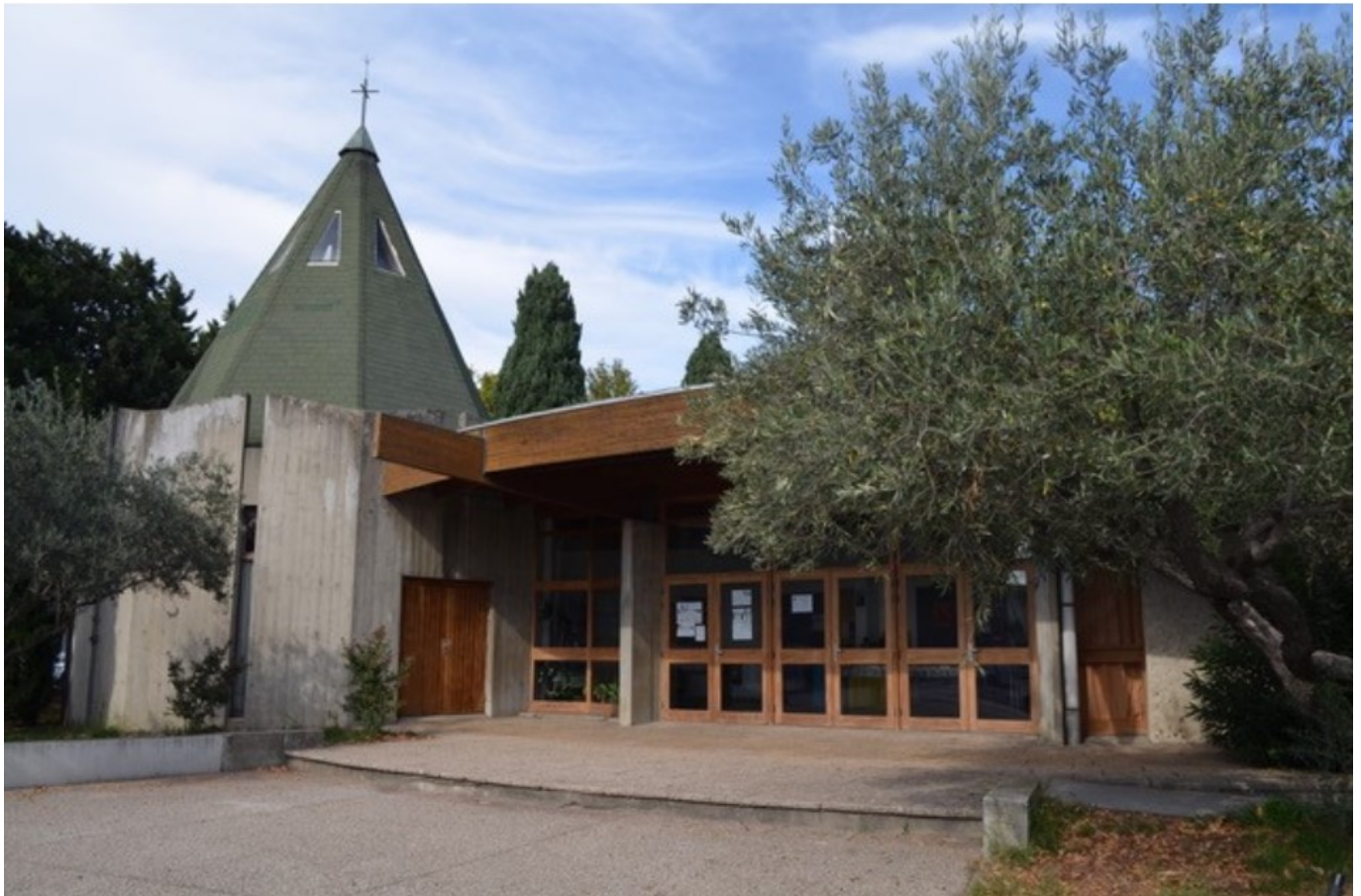
Jean XXIII