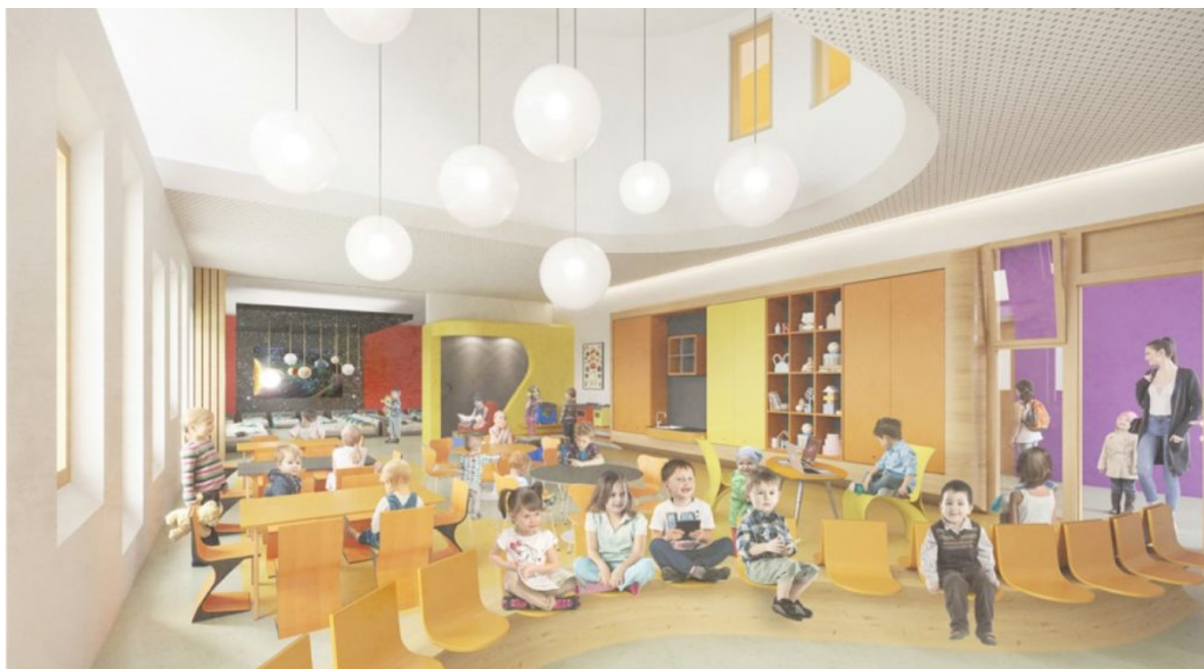
Une classe de maternelle vue de l'intérieur.