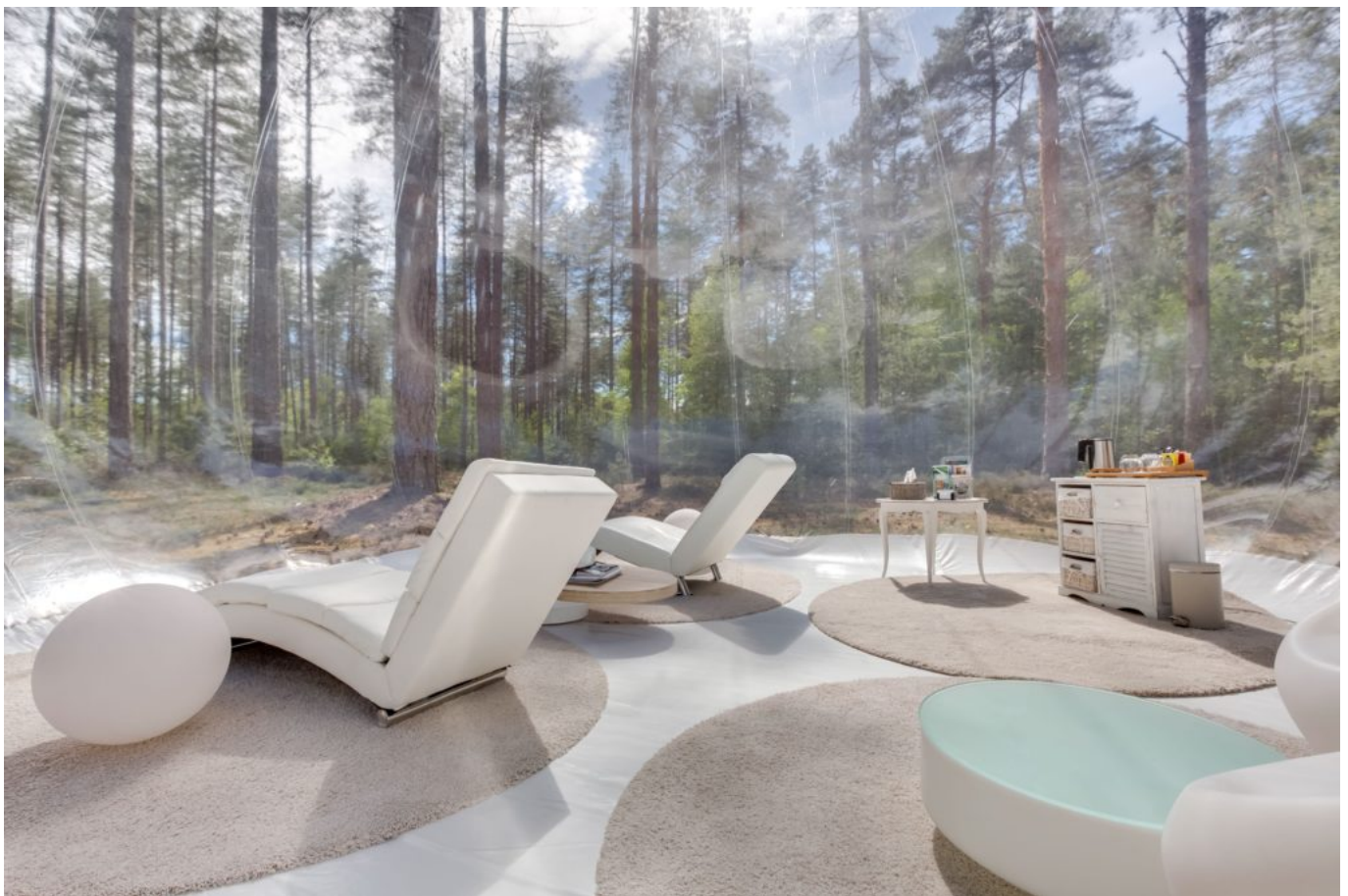
Bulle de cristal