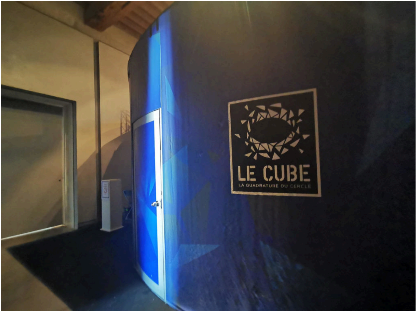
Le cube se dresse et vous appelle à l'évasion.