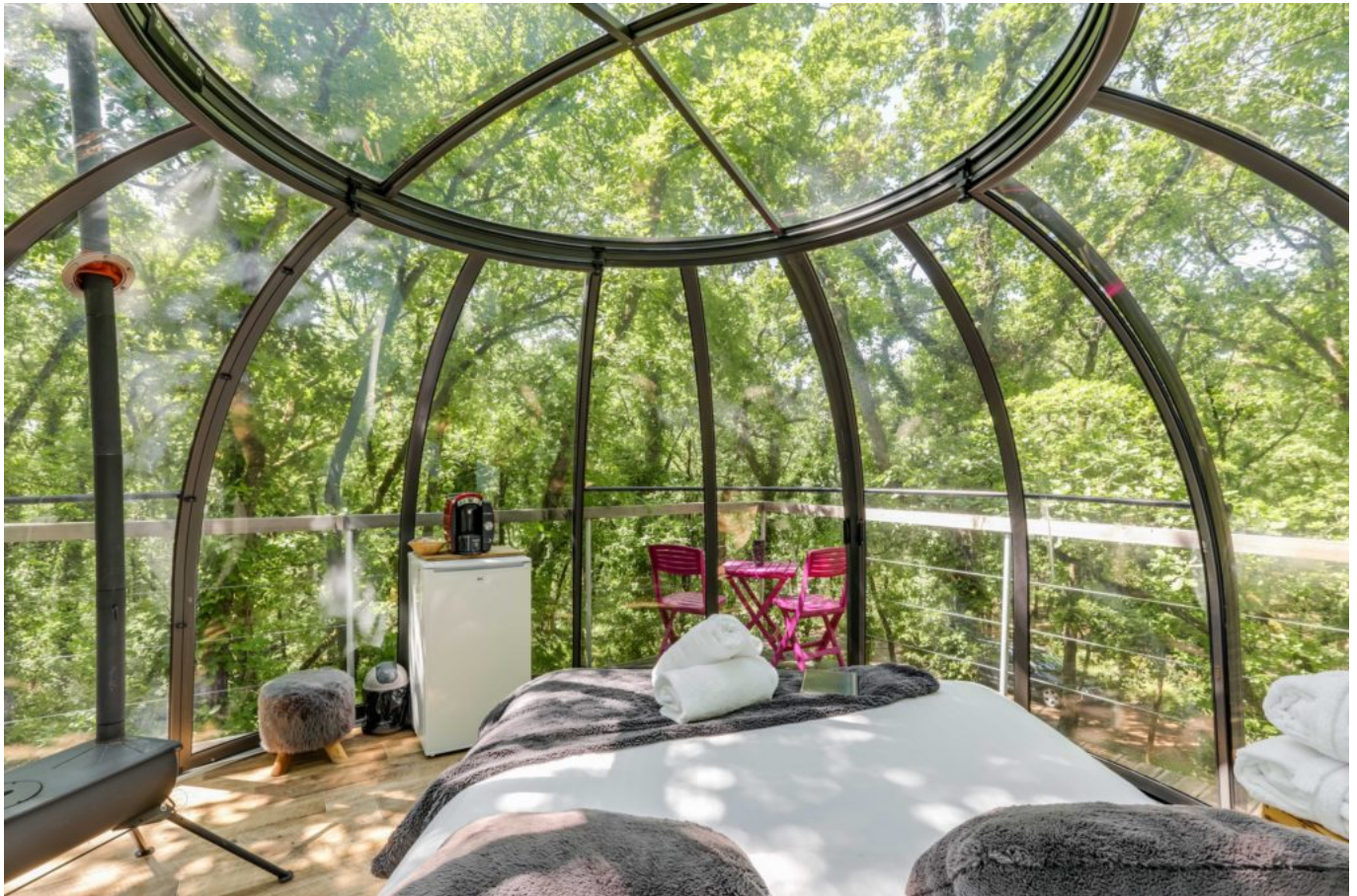
Lit bulle perchée

avoir quelques exemples, la Bretagne et l'Aquitaine recensent beaucoup d'hébergements. Mais il en existe absolument partout en France, même si dans le Vaucluse, on n'en compte un peu moins. Il y en a dans la Drôme également. »