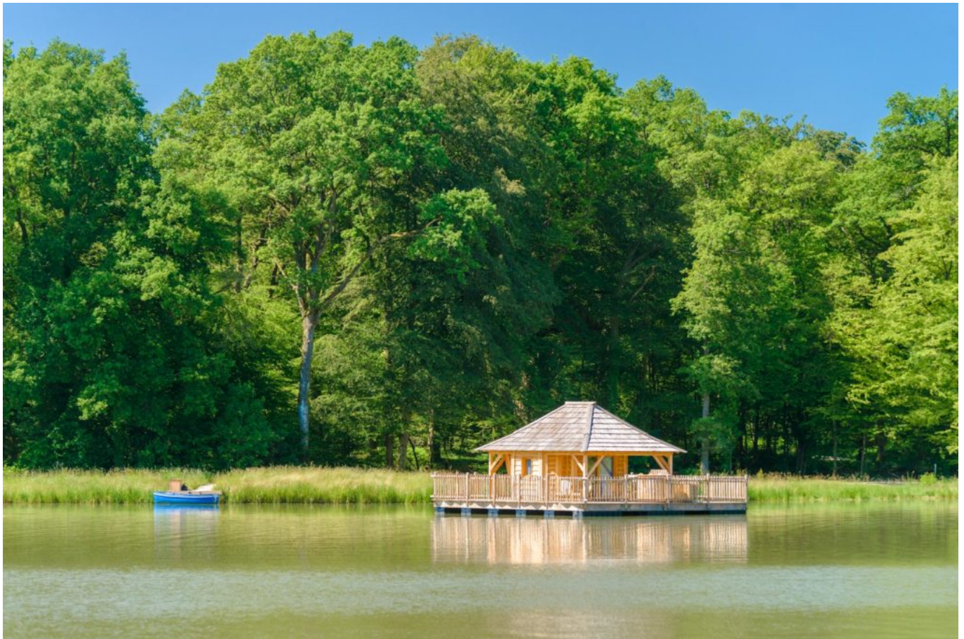
Cabane flottante

Le terme 'insolite', est propre au marché français. Il n'est pas encadré par la loi et, par conséquent, qualifier un hébergement d'insolite reste quelque chose de très subjectif. Pour limiter cette subjectivité, ils ont créé leur propre définition : « Un hébergement insolite est un hébergement qui surprend, qui étonne, qui sort de l'ordinaire, qui donne envie de tenter l'aventure. C'est en général un logement que l'on découvre pour la première fois, et qui amène de l'excitation avant même d'y aller. »