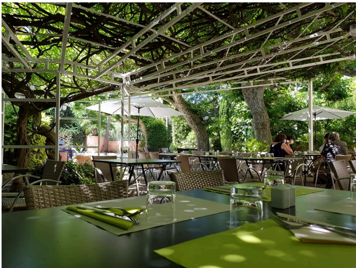
Photo: hôtel restaurant 3 étoiles 'La ferme'