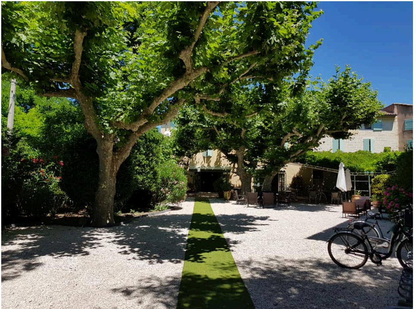
Photo: hôtel restaurant 3 étoiles 'La ferme'