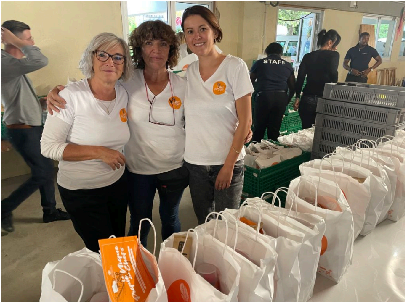
Des bénévoles pour la distribution des paniers du pique-nique des chefs