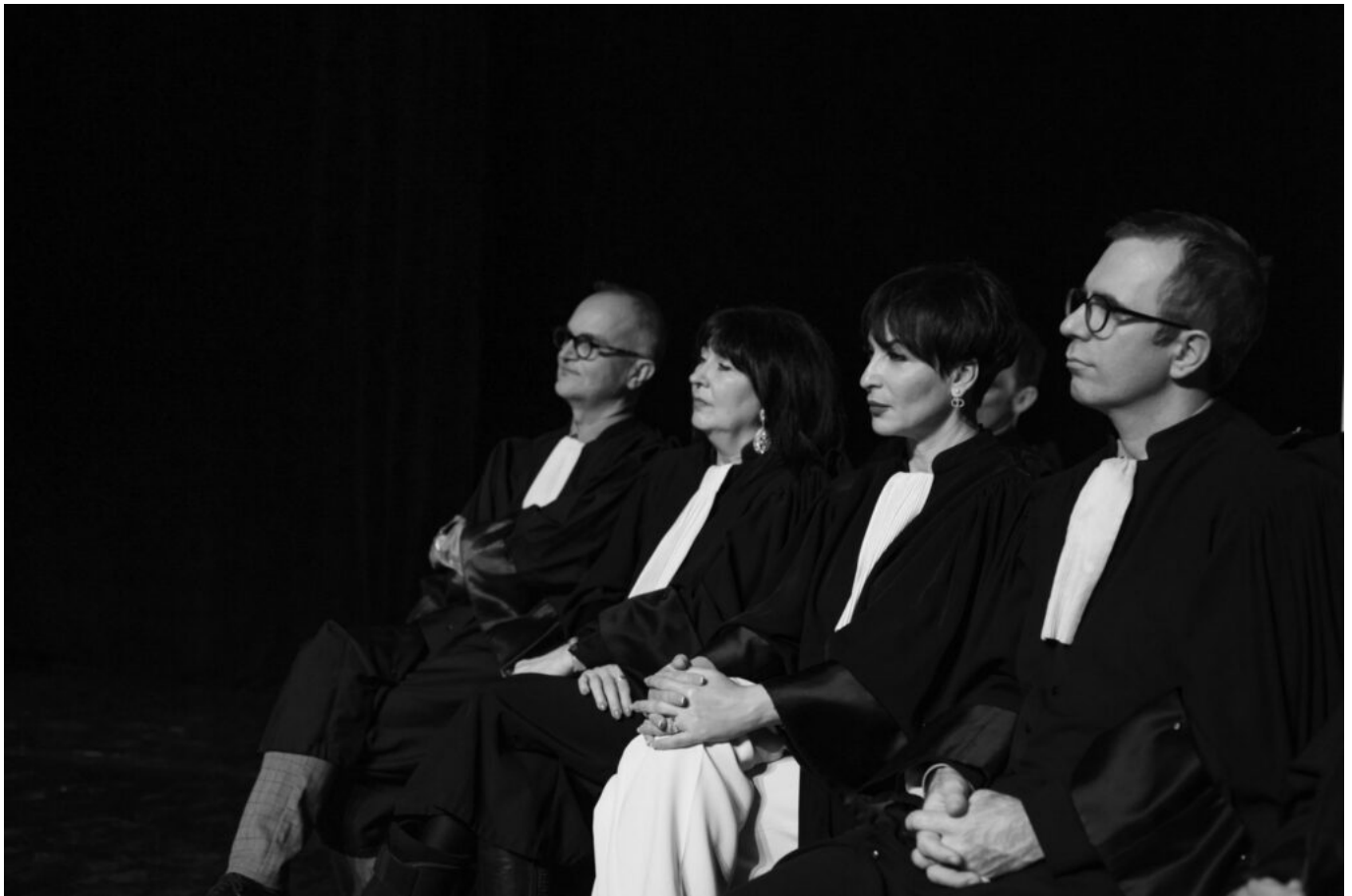
Les bâtonniers.