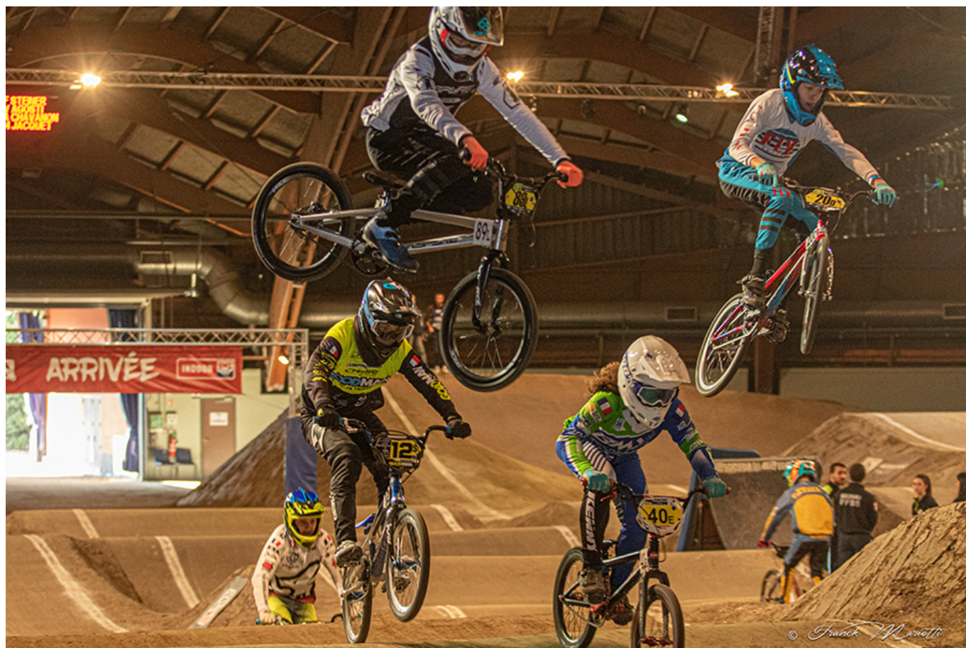
Indoor BMX pour les audacieux.