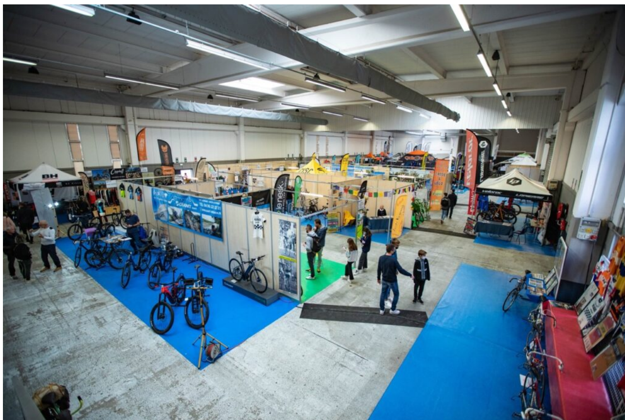
Le village des exposants.