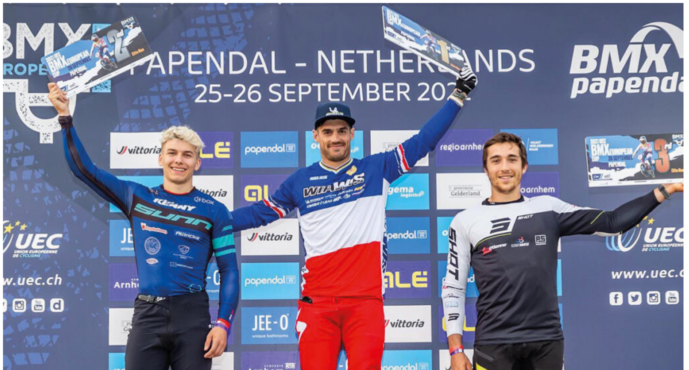
Sylvain André, vainqueur de la coupe du monde de BMX Racing 2022