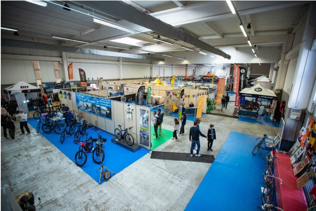
Le village des exposants.