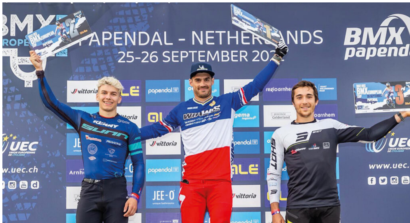
Sylvain André, vainqueur de la coupe du monde de BMX Racing 2022

Cette 5 e édition ne sera pas en manque de nouveauté et proposera des animations sportives et festives orchestrées par les grandes marques de fabricants de cycles et d'équipements. De nouvelles disciplines spectaculaires feront leur entrée au festival avec le Polo-Vélo et la Bike Life, et la piste de BMX Indoor se verra doter de virages en enrobés, une première en France grâce à Hurricane Tracks .