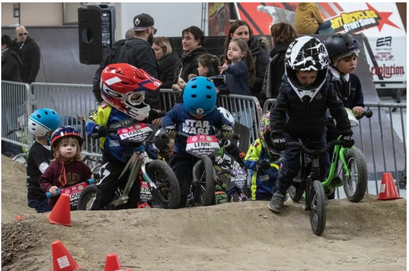
Les enfants de 2 à 5 ans pourront découvrir l'univers de la draisienne

Les enfants de 5 à 11 ans pourront passer de la draisienne au vélo avec le Pitchouns Bike Dual Slalom. Cette piste en accès libre proposera un parcours constitué de modules adaptés à la pratique de la draisienne et du vélo premier âge. Cette activité sera également encadrée par le centre social et culturel l'Espélido qui fournira aux enfants le matériel nécessaire : vélos, draisennes et casques.