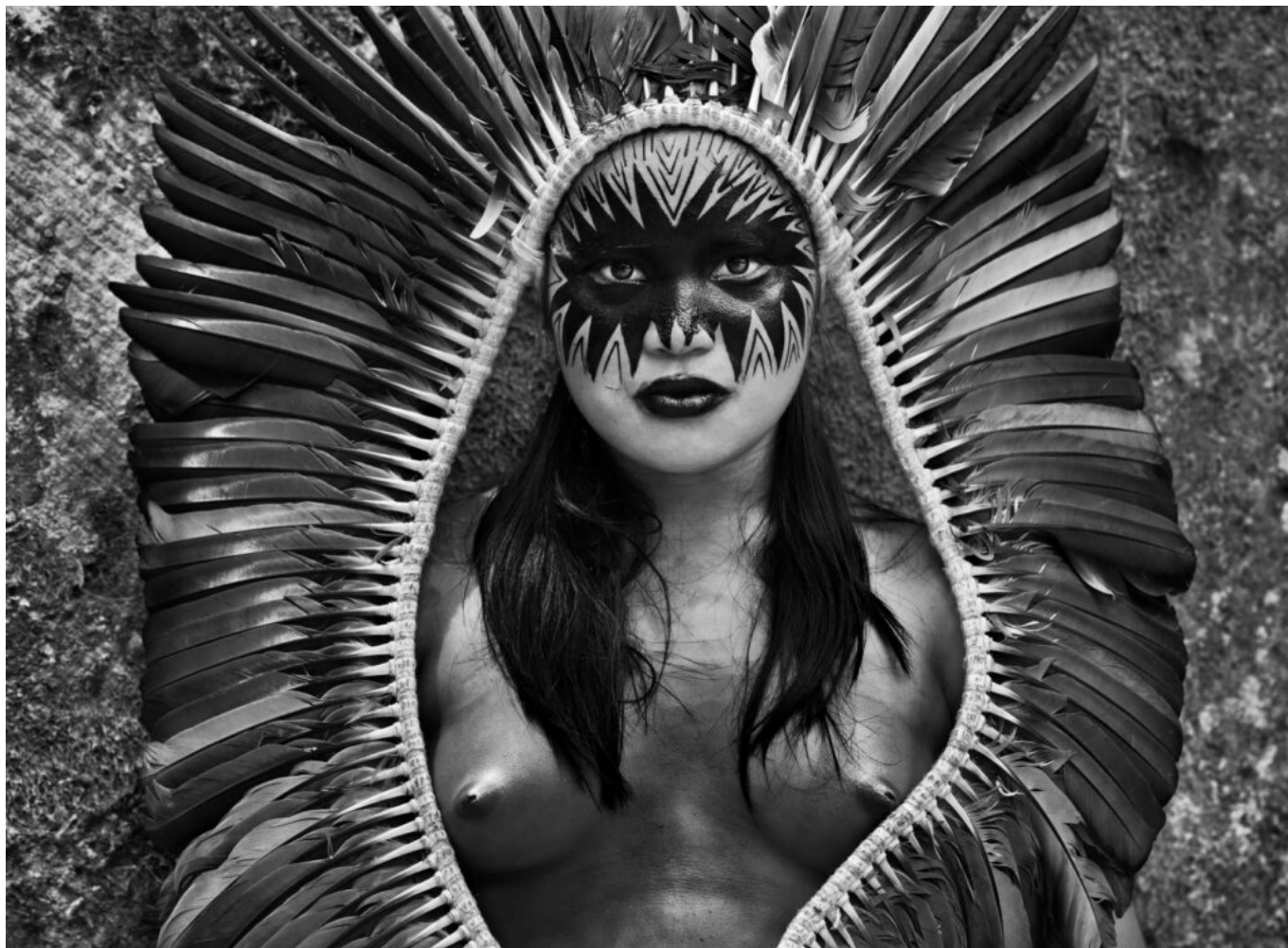
Indienne Yawanawá, État d'Acre, Brésil, 2016.