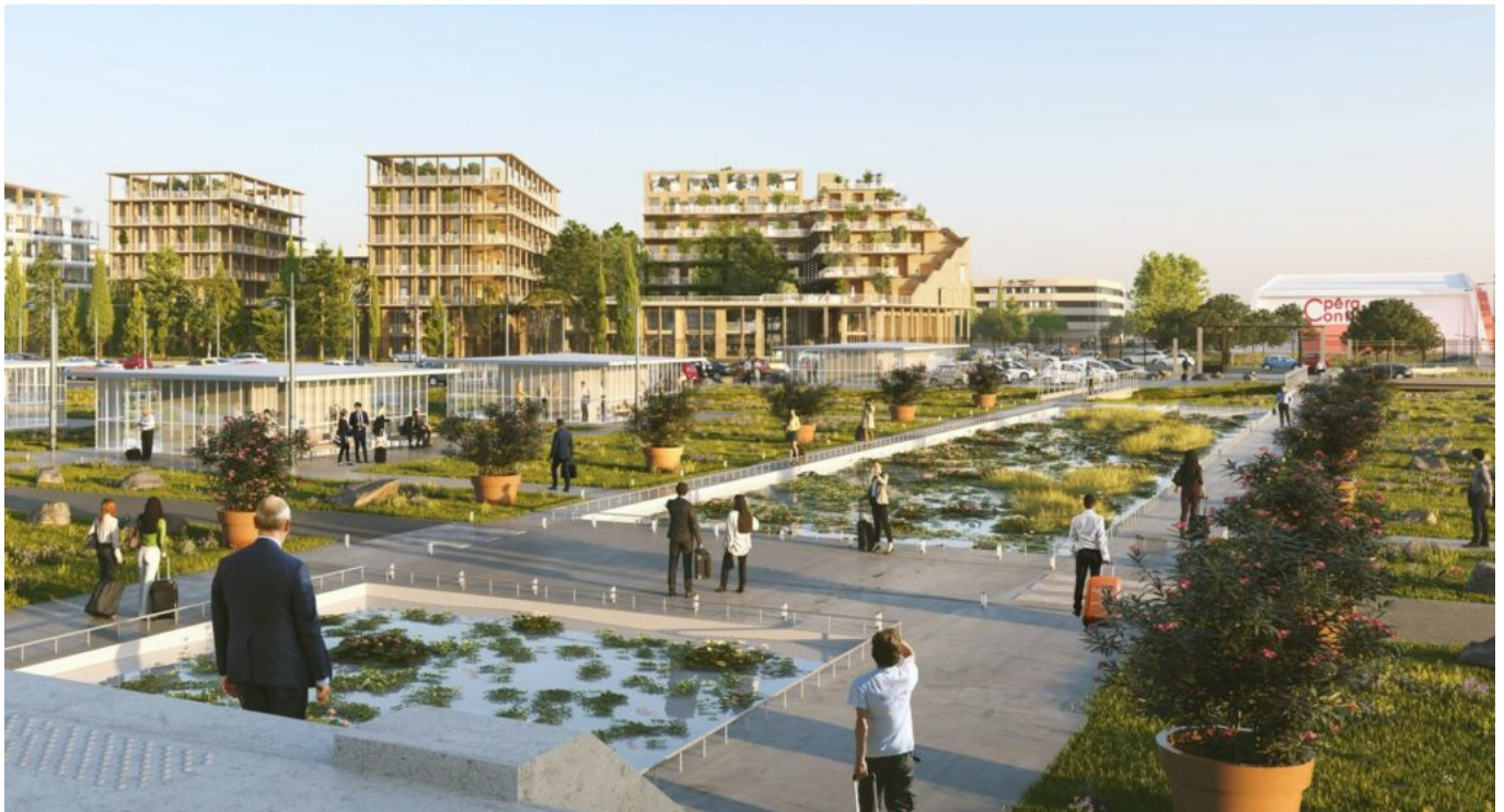
Le 1er macro-lot d'Avignon-Confluences vu depuis le parvis de la gare. ©Leclercq Associés &

Il faut dire qu'en guise de cadeau d'adieu, beaucoup pointent du doigt en 'off' une ministre, aussi rancunière que malheureuse après des élections municipales perdue à Avignon en 2001, d'avoir eu 'la bonne idée d'œuvrer' à ce que l'évaluation des risques d'inondation ne soit plus estimée par rapport à une crue centennale mais par rapport à une crue millénale. Et histoire de bien verrouiller l'affaire, outre le Rhône, ce risque avait été aussi étendu à la Durance. Pas étonnant dans ces conditions que les programmes apparaissent au compte-gouttes et qu'il soit difficile de réaliser des projets d'envergures comprenant notamment un geste architectural emblématique.