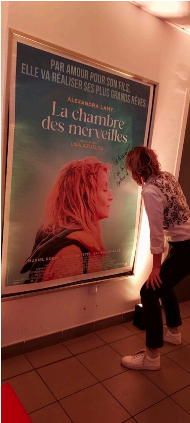
Alexandra Lamy dédicace l'affiche du film au Capitole.