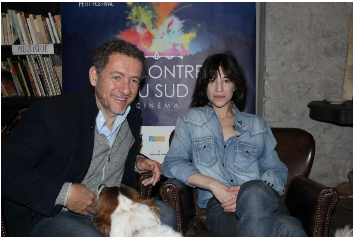
Dany Boon et Charlotte Gainsbourg.

regard décalé sur le monde. Il suffit de pas grand-chose pour faire basculer les échanges sociétaux du bon côté. Louis ne voit pas la chance qu'il a d'avoir Roxane. Chacun est dans son monde. » Tridan avec sa personnalité va apporter quelque chose dans l'univers de Louis mais aussi dans celui de Roxane qui est une femme libre et authentique. Une Roxane interprétée avec sincérité et subtilité par Charlotte Gainsbourg qui apporte tout son talent dans ce trio amoureux.