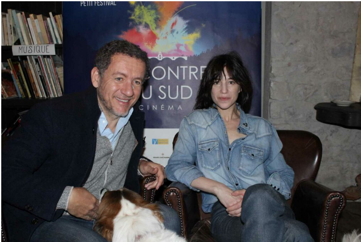
Dany Boon et Charlotte Gainsbourg.

regard décalé sur le monde. Il suffit de pas grand-chose pour faire basculer les échanges sociétaux du bon côté. Louis ne voit pas la chance qu'il a d'avoir Roxane. Chacun est dans son monde. » Tridan avec sa personnalité va apporter quelque chose dans l'univers de Louis mais aussi dans celui de Roxane qui est une femme libre et authentique. Une Roxane interprétée avec sincérité et subtilité par Charlotte Gainsbourg qui apporte tout son talent dans ce trio amoureux.