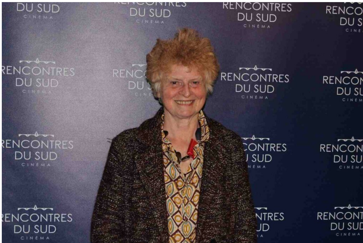
Claire Simon.

Il y a beaucoup d'émotion dans ce superbe documentaire. De la joie, de la peine, de la tendresse, de la dureté. Des scènes qui touchent au cœur. Comme cette jeune femme atteinte d'un cancer. Une maladie qui tombe aussi brusquement sur la cinéaste qui passe à son tour devant la caméra.