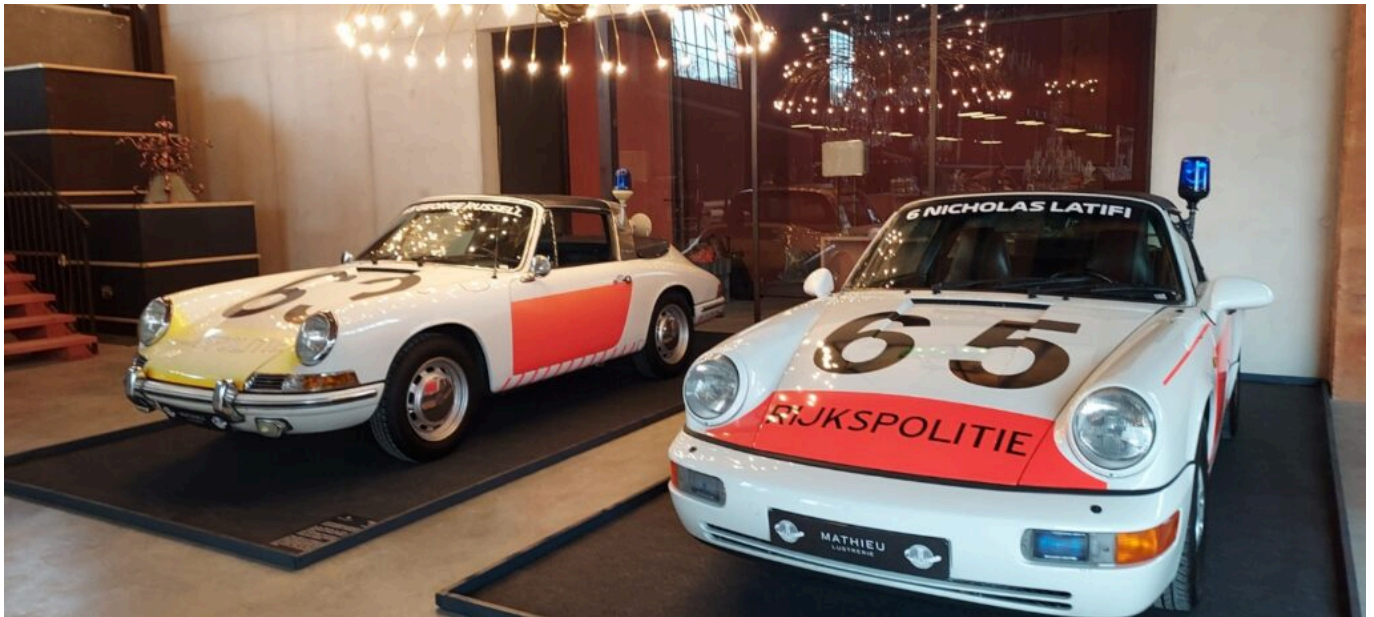
A gauche la police de Suède et à droite la police des Pays Bas

Avec cette extension, la Lustrerie Mathieu compte désormais 24 bassins de décantations d'ocres, des écluses, des malaxeurs, des fours, « Une vraie archéologie industrielle qui garde son âme, la machinerie d'avant, la mémoire de cette ancienne usine, au milieu d'un immense jardin où les gens pourront se promener, dedans et dehors, voir les lustres exposés à l'intérieur et éclairés. Je me dois de faire, dans la mesure du possible, de belles choses, qui durent, qui donnent du bonheur aux autres. »