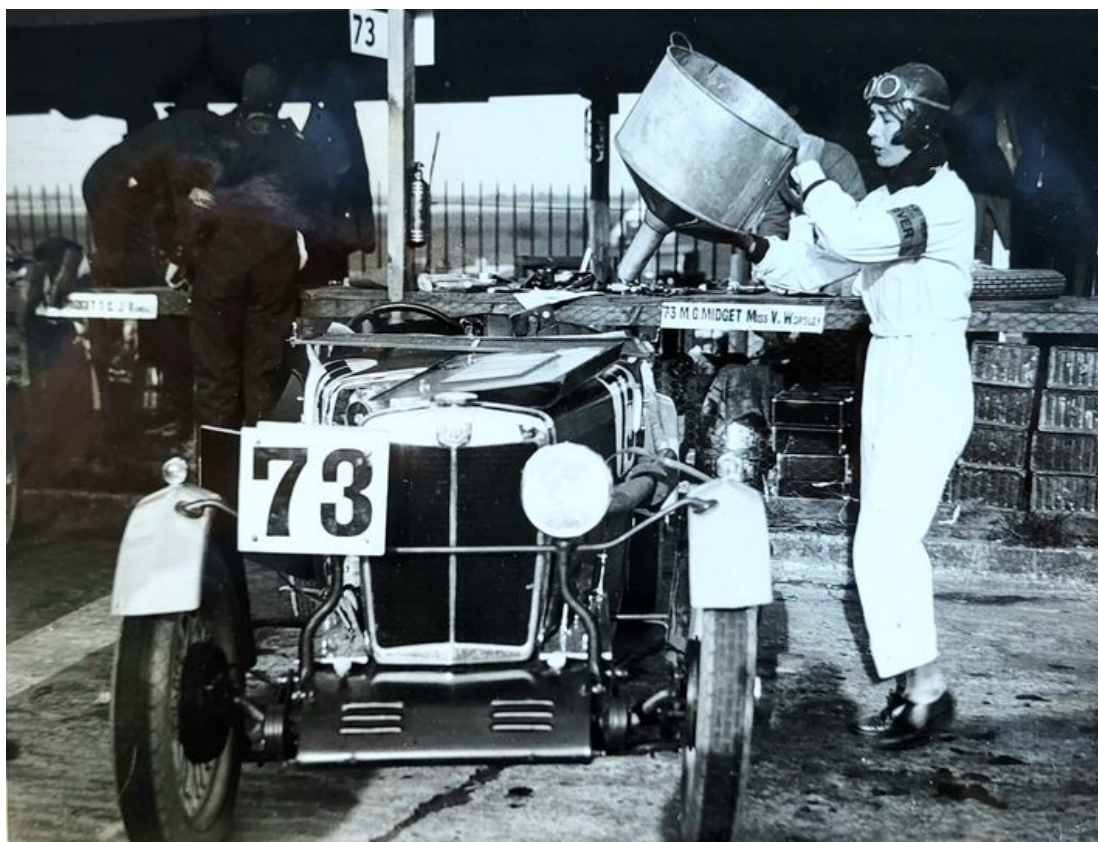
Une des photos qui seront exposées à Motor Passion.

Cabriolets, coupés, berlines, limousines, voitures de rêve et de légende, Jaguar Type E, Maserati, Lotus, Rolls-Royce, Traction avant, Mini, 4CV, BMW, Lamborghini, Ferrari, Buick, Citroën SM, Porsche, trôneront au Parc des Expositions. Ainsi que l'Alpine bleue A 110 de l'EDSR (Escadron départemental de la Sécurité Routière de la Gendarmerie de Vaucluse). « Un hommage sera rendu aussi à l'Autodrome d'Istres-Miramas (Bouches-du-Rhône), explique Florent Bourges, commissaire d'exposition. Créé en 1924 où une Simca 'Ariane 4' a parcouru 200 000 km à 100km/h en 5 mois, un record du monde d'endurance. Cette Ariane historique sera exposée dans le Hall A. Comme la 'Djelmo' qui a battu le record de vitesse de 257km/h sur ce même anneau des bords de l'Etang de Berre il y a 100 ans. » Avignon Motor Passion (22-24 mars), c'est aussi le paradis des pièces détachées, des voitures radiocommandées et des miniatures.