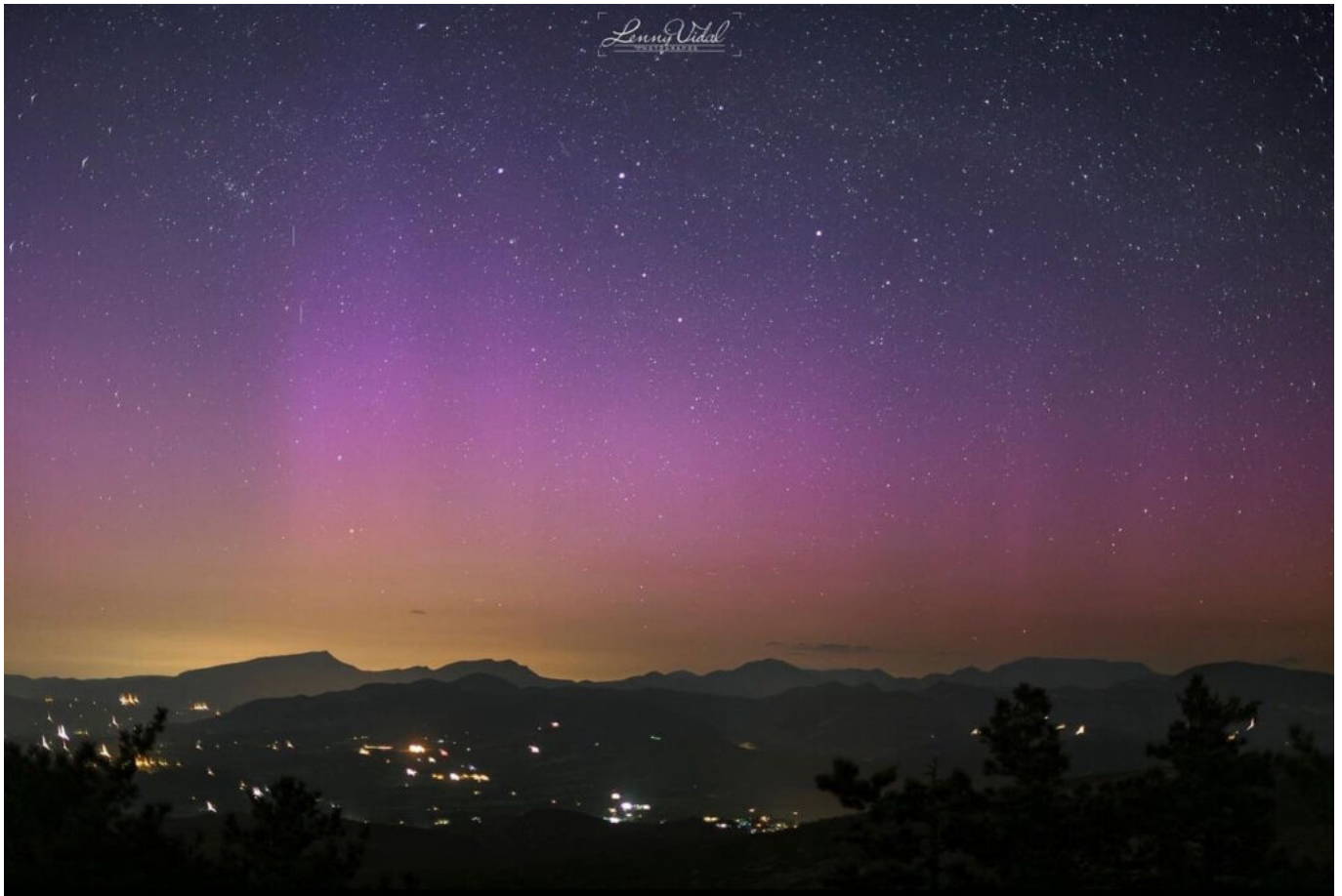
Photo prise par le photographe Lenny Vidal dans la nuit du samedi 11 au dimanche 12 mai. ©Lenny Vidal