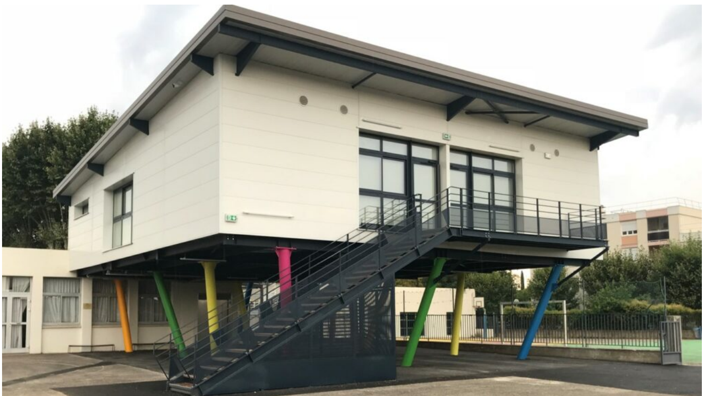
L'école Giono à Tarascon.