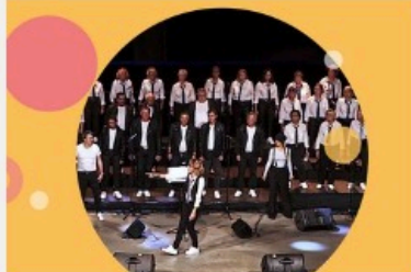
Berger Balavoine... La Story