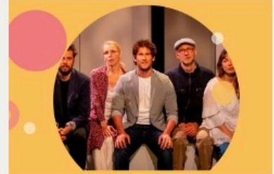
La vie est une fête