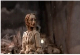
Le Dernier Jour de Pierre