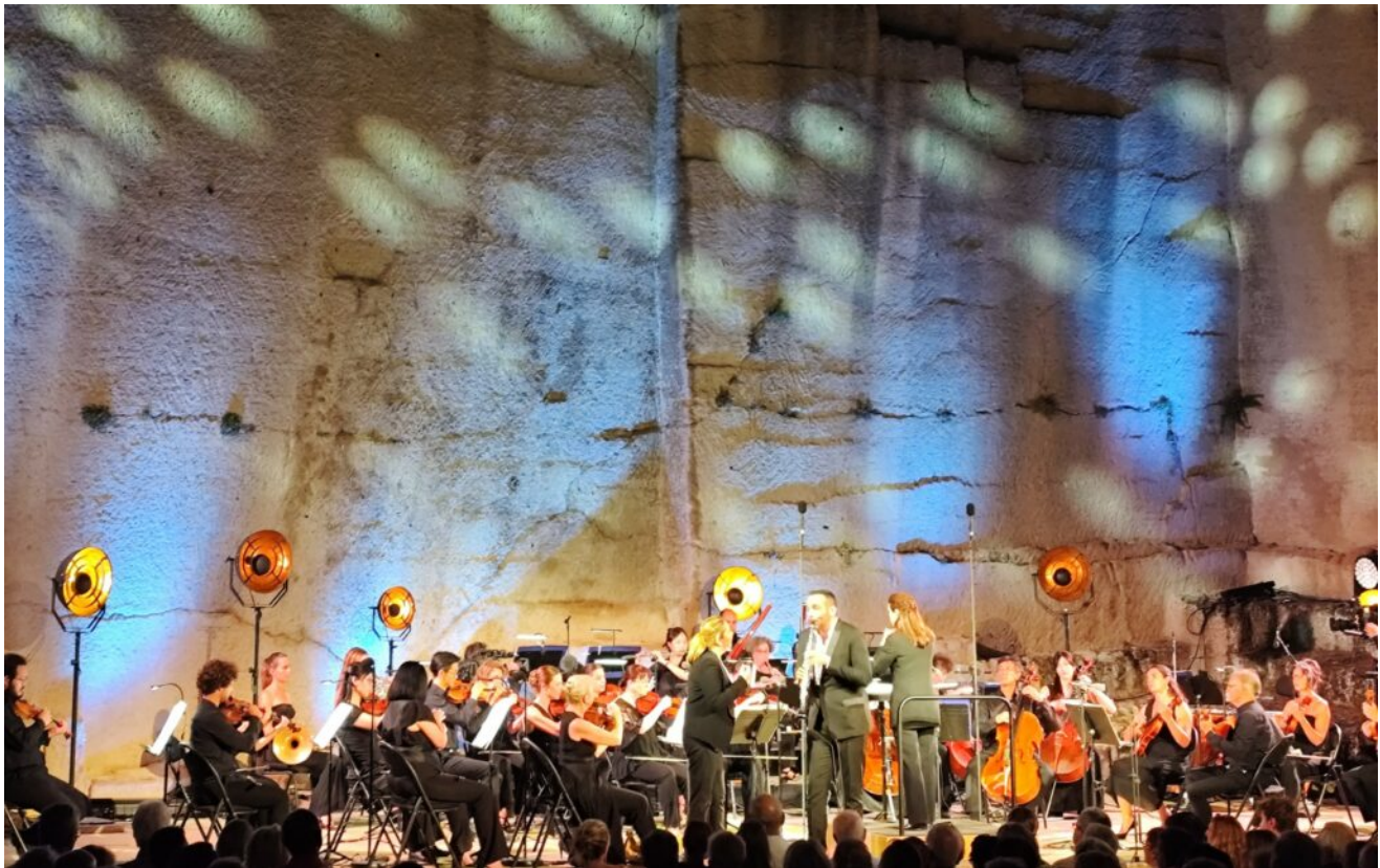
L'Orchestre national Avignon-Provence en concert aux Taillades.