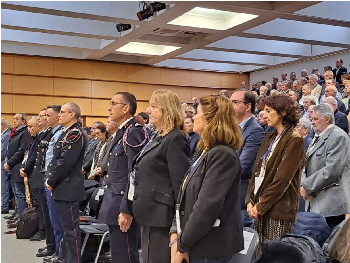
Une minute de silence en hommage aux élus décédés en 2023.