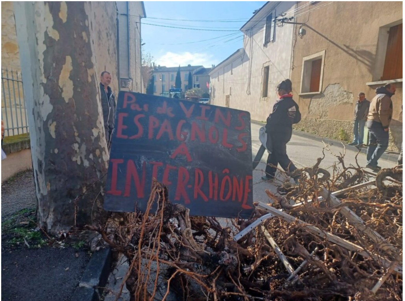
Manifestation à Sablet.

pas à se plier à des injonctions de normes aussi drastiques que les nôtres. Au début de l'année, on a vu les Jeunes Agriculteurs retourner les panneaux de signalisation à l'entrée des villes et villages pour montrer qu'on marchait sur la tête. Mais personne, dans les hautes sphères, n'a fait attention à ces signaux d'alarme.