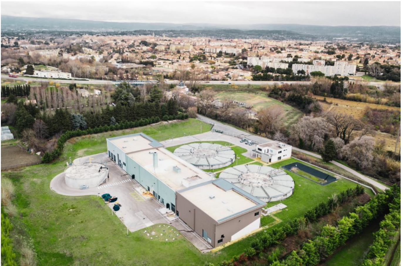
La station d'épuration des eaux usées de Carpentras.