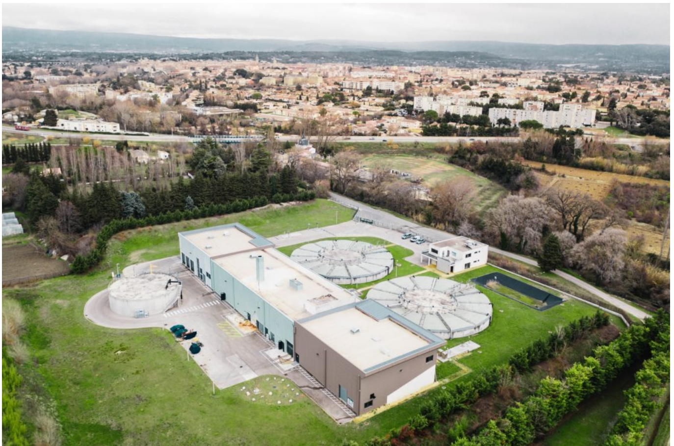
La station d'épuration des eaux usées de Carpentras.