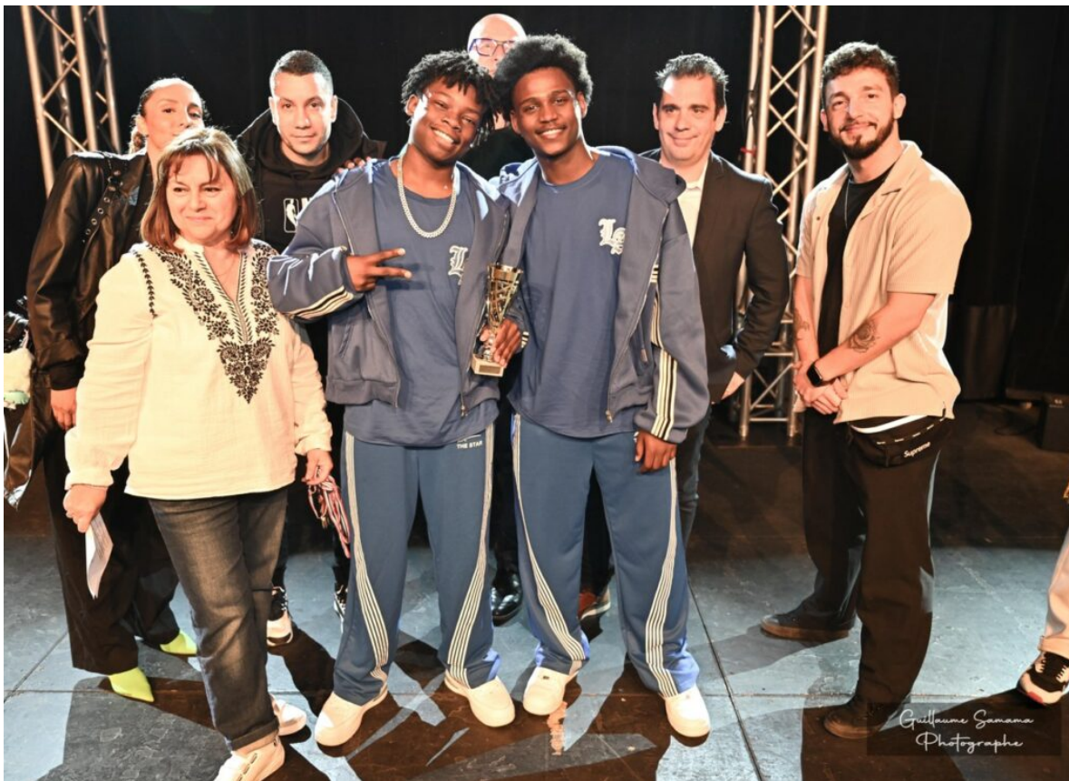
Les Two Black Brothers de l'école LNB de Bagnols-sur-Cèze.