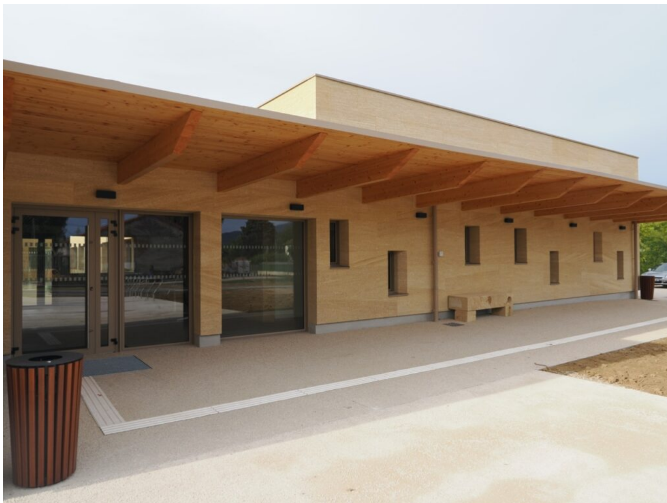
La salle Sandrine Martinet

La salle Sandrine Martinet sera inaugurée le samedi 12 octobre à 18h en présence de la championne paralympique.