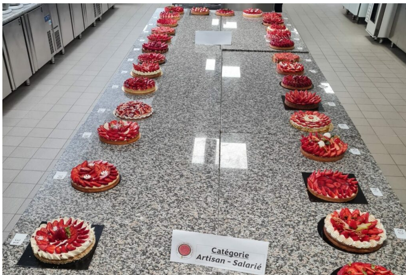
© Groupement des artisans Boulangers Pâtissiers du Vaucluse