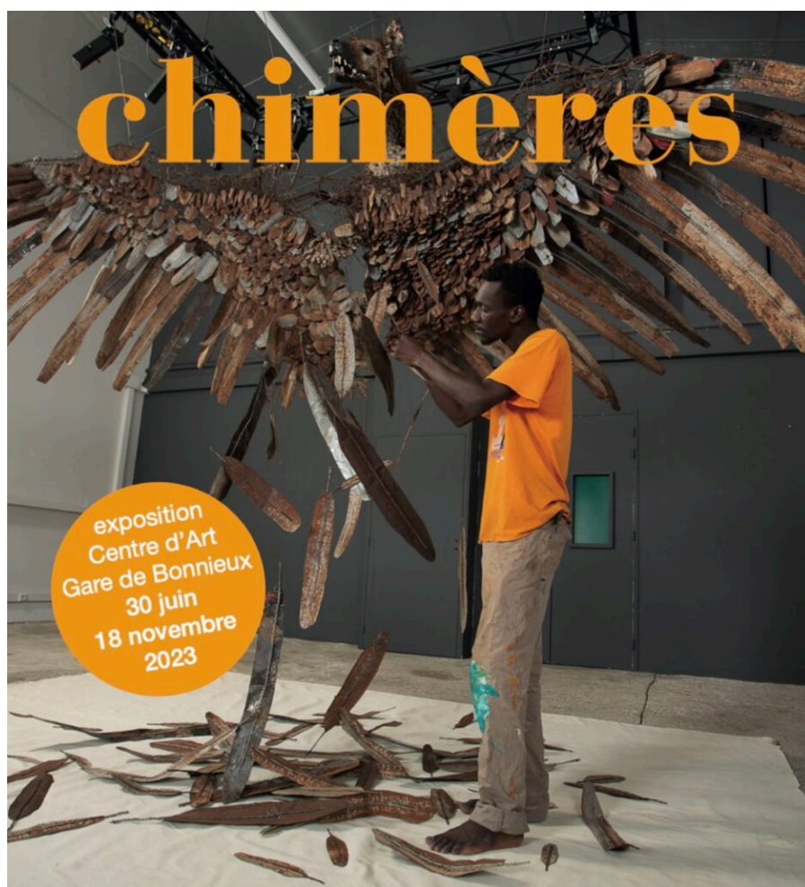
Affiche de l'exposition, avec l'œuvre 'Chimère' d'Oumar Ball.

Le public pourra ainsi découvrir les œuvres exposées dans trois salles. La première salle sera destinée aux grandes sculptures et installations, elle sera travaillée comme celle d'Apt, c'est-à-dire qu'on entre dans un bloc noir, seules les œuvres sont illuminées pour créer une ambiance très intimiste. La deuxième salle sera réservée aux peintures et photographies. Les œuvres de la troisième salle, à l'étage, seront quant à elles exposées à la lumière naturelle.