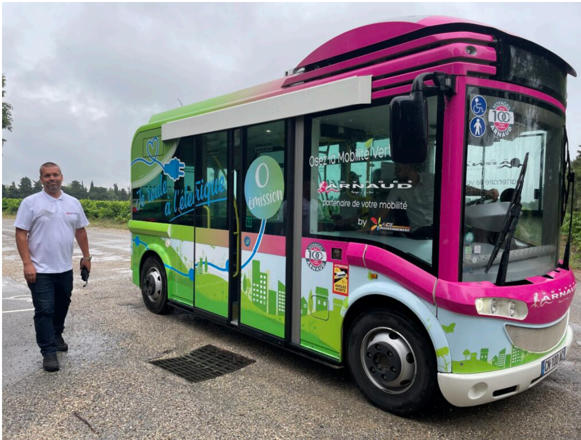
Navette électrique

En quelques chiffres, la double activité transports / agence de voyage de cette entreprise centenaire, ce sont 160 collaborateurs, 4 millions de kilomètres parcourus, un chiffre d'affaires de 12,5M€, 3 millions et demi de voyageurs transportés par an. 3 500 élèves, écoliers, collégiens, lycéens par jour, des lignes régionales, avec des véhicules récents, sûrs, bien entretenus, confortables et accessibles aux handicapés. Principales destinations : vers l'Espagne, l'Italie, la Croatie, la Principauté d'Andorre. Avec les agences de l'Isle sur la Sorgue et Carpentras, sont organisés des voyages clés en main pour les groupes, les associations, les CE, avec un programme culturel, des visites de sites historiques, un itinéraire au cas par cas. Mais aussi des billetteries air-mer-chemins de fer. Arnaud Voyages propose aussi la location de véhicules pour 4 à 78 places, avec ou sans chauffeur, des navettes VIP pour « voyageurs d'affaires ».