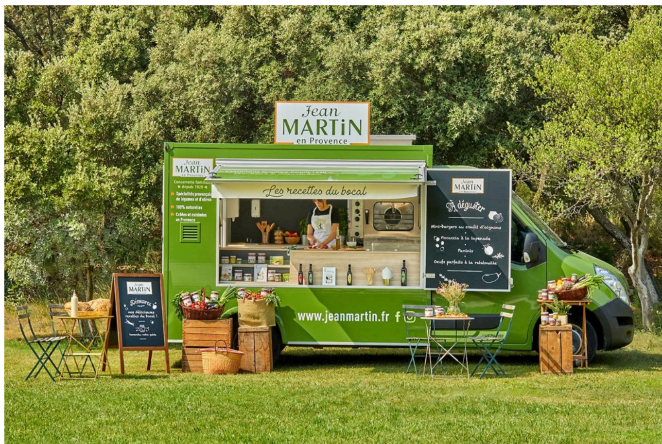
Food truck Jean-Martin

Informations pratiques : du jeudi 18 au lundi 22 novembre, de 10h à 20h, nocturne le vendredi jusqu'à 23h. Palais des congrès d'Arles : avenue 1ère division France Libre. Entrée : 8 euros, gratuit pour les moins de 12 ans, prévente tarif réduit jusqu'au 15 novembre inclus. Demi-tarif pour les enfants de 12 à 18 ans.