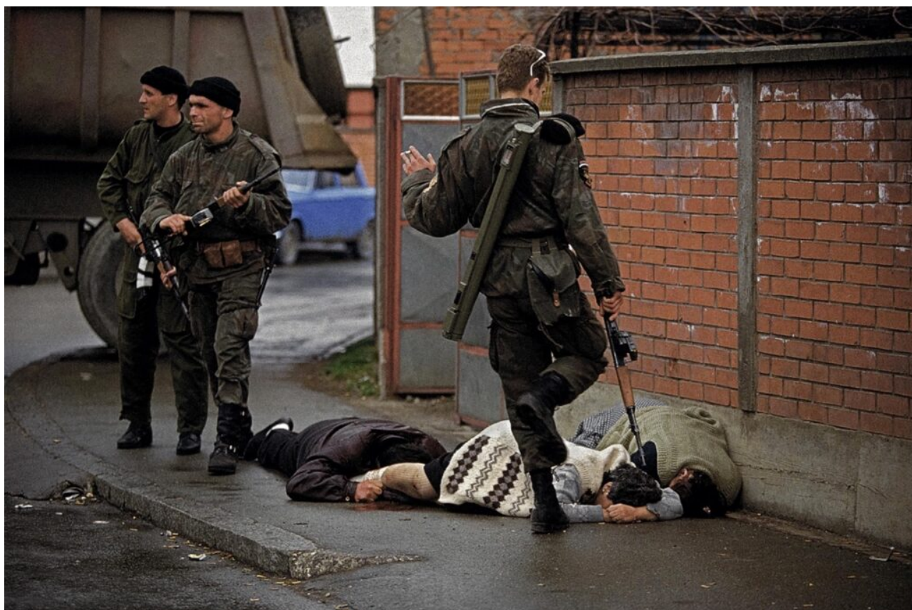
(Bosnie, avril 1992)