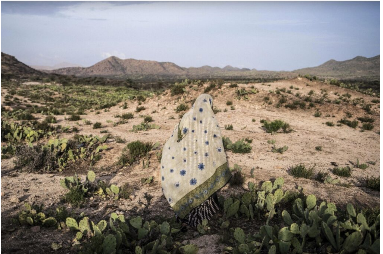
© Nichole Sobecki (Somaliland, avril 2016)