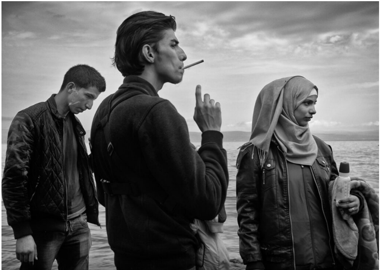
(Grèce, septembre 2015)