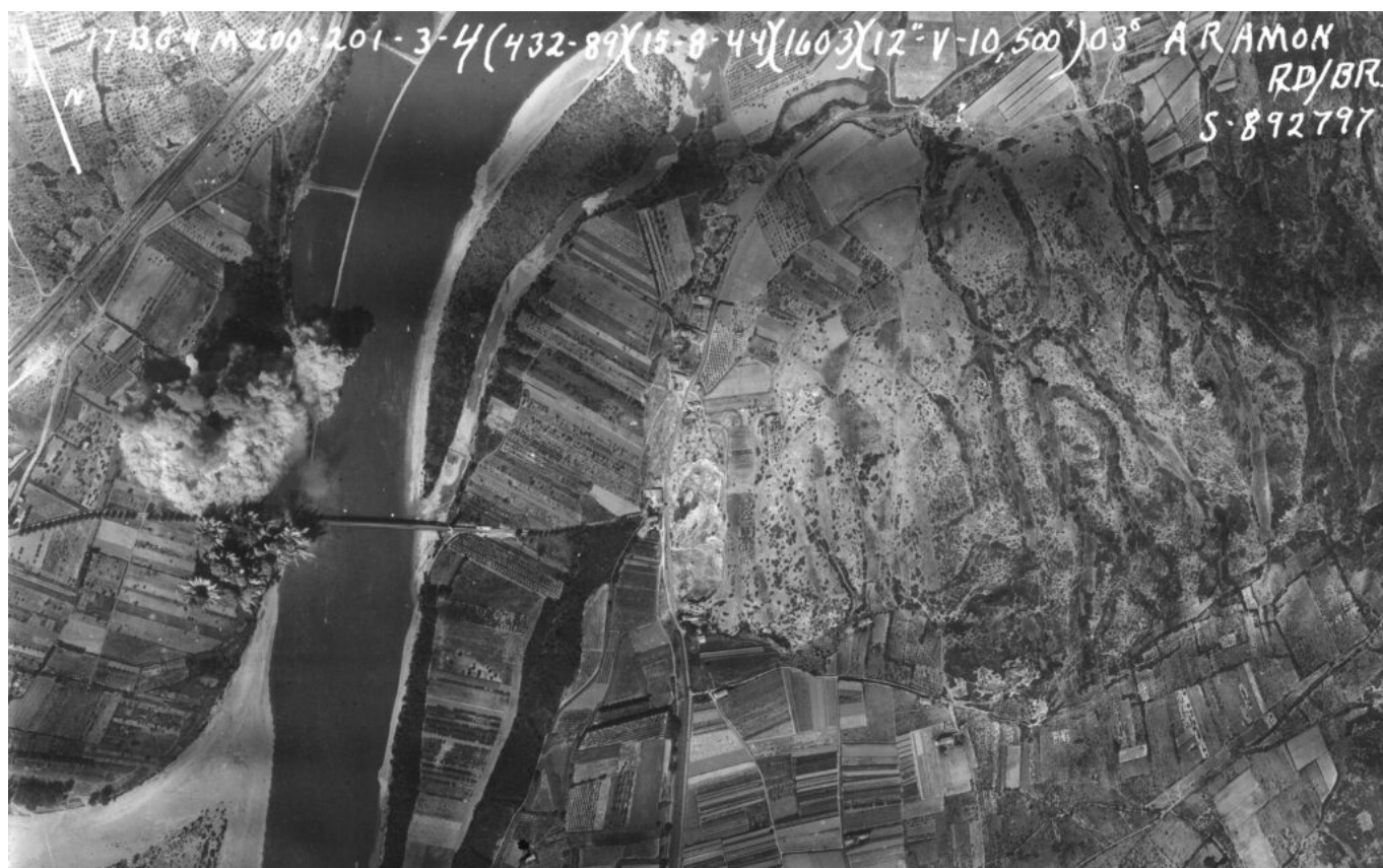
15 août 1944, 16h03 : les bombes larguées par les appareils du 17th Bomb Group explosent autour de l'extrémité Ouest du pont routier d'Aramon.