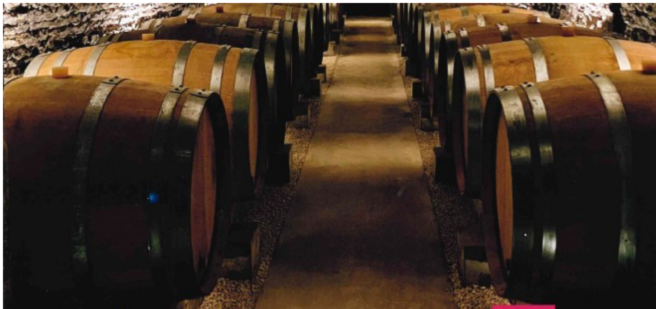
Les grands vins