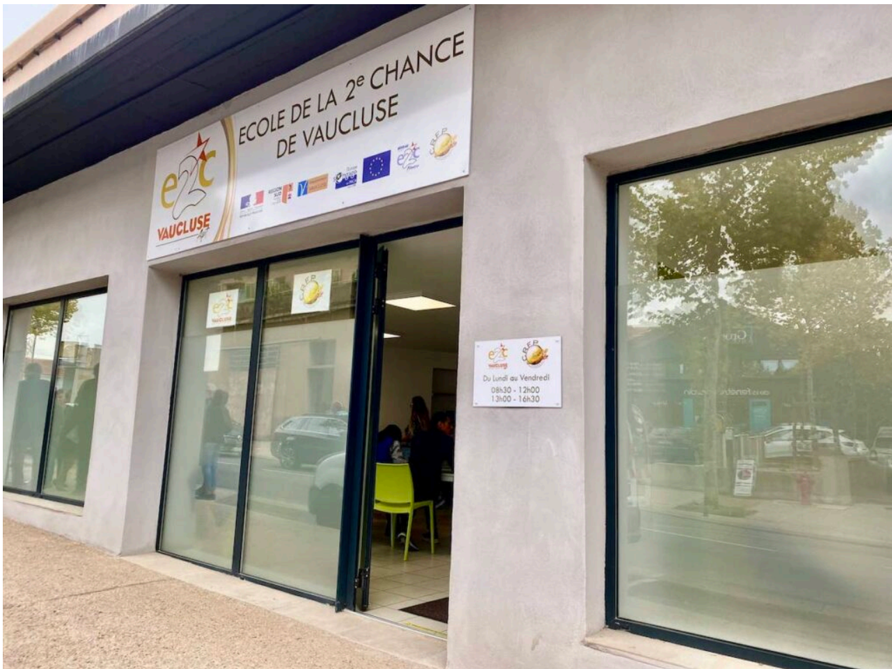
L'antenne aptésienne.