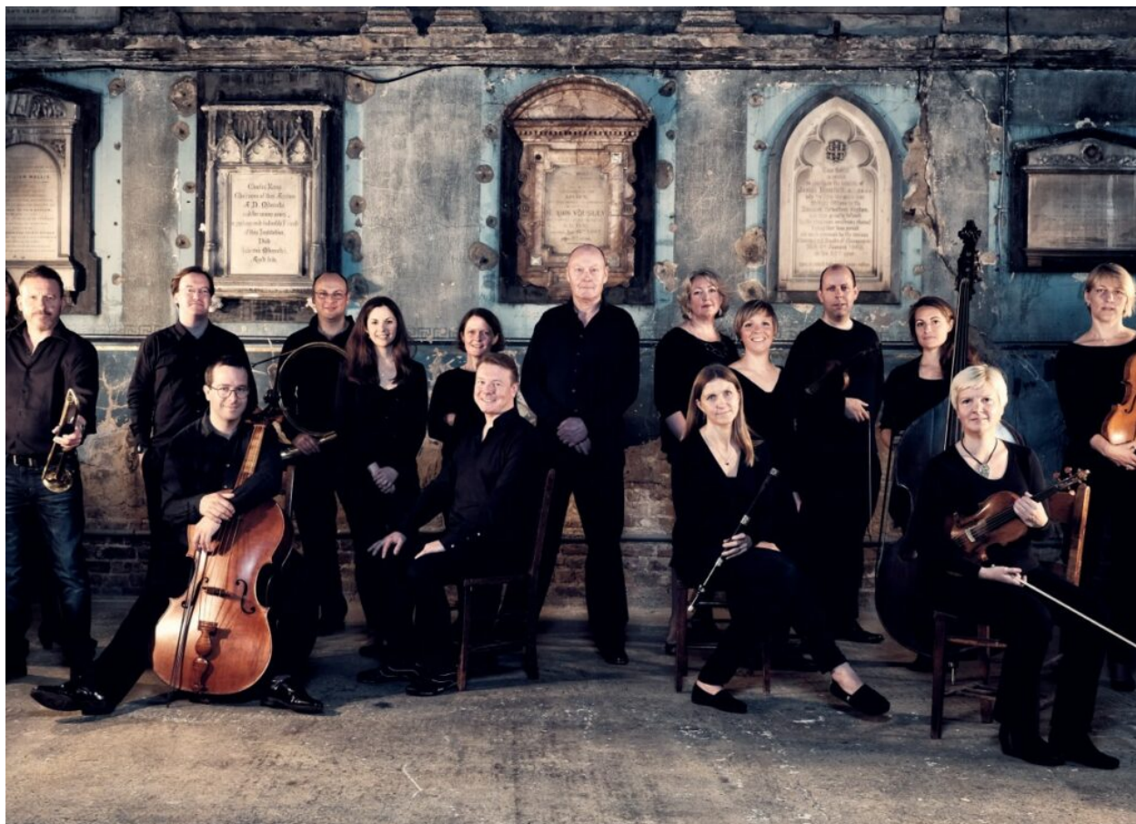
“King Arthur” par le Gabrieli Consort le 09 juillet place de l'Horloge à Ménerbes