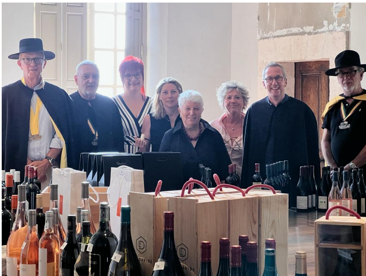
Les organisateurs de la vente aux enchères.