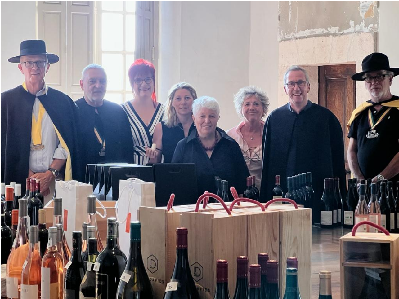
Les organisateurs de la vente aux enchères.