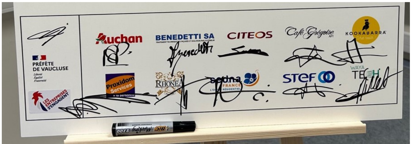
Les 10 nouvelles entreprises signataires de la convention.

L'hypermarché Auchan du Pontet, Benedetti SA à Avignon, Citeos , le Café Grégoire à Apt, Kookabarra à Cavaillon, Proxidom services à Venelles, Rhonéa à Beaufort-de-Venise, Sedna France à Orange, Steph et Wayatech à Avignon rejoignant ainsi les 25 autres sociétés vauclusiennes déjà signataires.