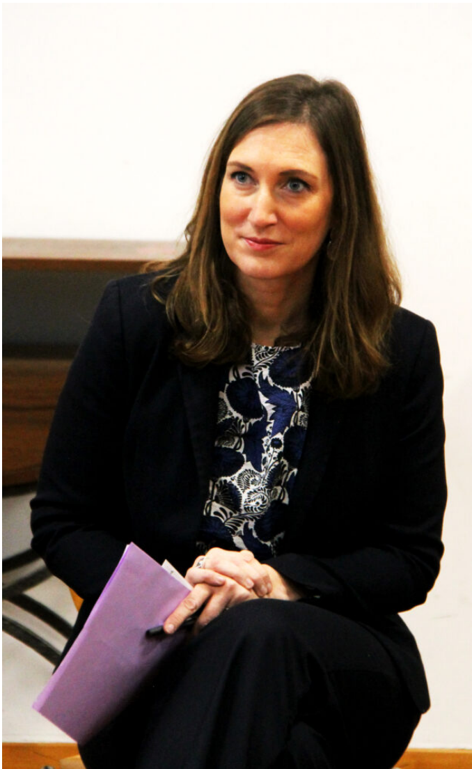
Carole Grandjean.

leur diplôme ou décrochent trop rapidement lorsqu'ils poursuivent leurs études dans l'enseignement supérieur. Il nous faut diminuer le nombre de décrocheurs (deux tiers de décrocheurs scolaires sont issus des lycées professionnels) et rapprocher réellement l'école de l'entreprise pour faire face aux enjeux des compétences. Cette réforme est structurelle et résolument tournée vers les jeunes. L'un des objectifs est de prendre en compte leurs singularités, leur transmettre le goût de l'engagement dans leurs propres parcours, les former aux enseignements généraux et ainsi les préparer à l'emploi et accompagner celles et ceux qui le souhaitent vers une poursuite d'études réussie.