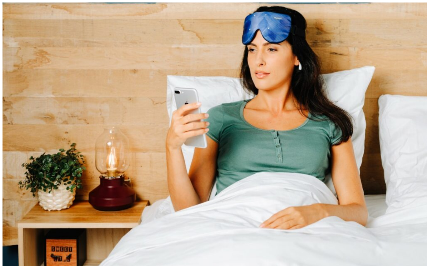
Masque et appli Hypnos