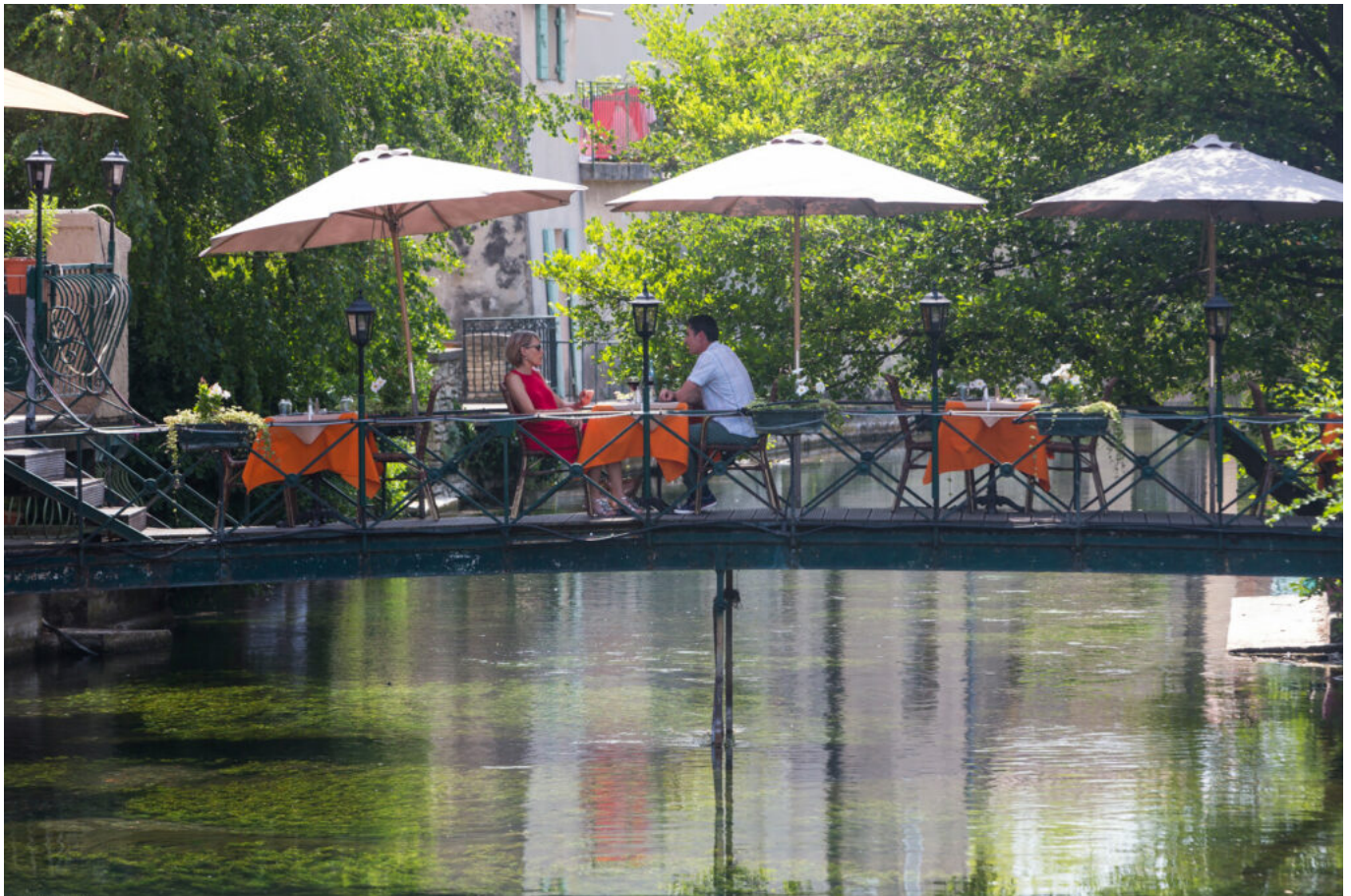
GAILHOL X - VPA

À l'occasion de la deuxième de la journée des terrasses qui s'est tenue cette semaine, France Boissons a publié un baromètre qui témoigne de l'attachement des Français aux terrasses et a révélé des chiffres régionaux inédits. Les natifs du Sud-Est sont ainsi ceux qui vantent le plus le mérite de leurs terrasses, ces lieux de vie incontournables.