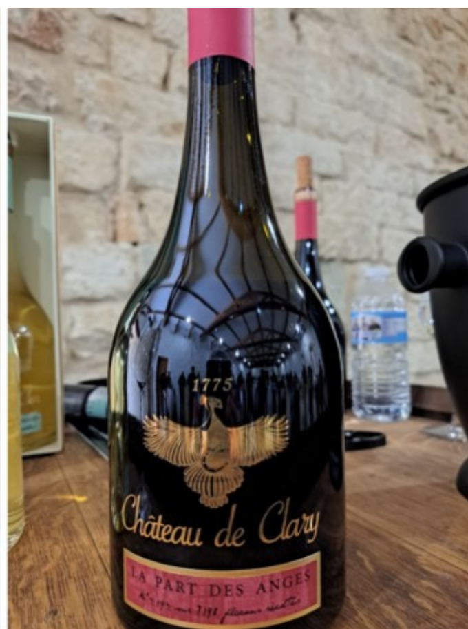
Cyril Chéhovah, du Château Clary à Roquemaure etsa cuvée 'La part des anges'.