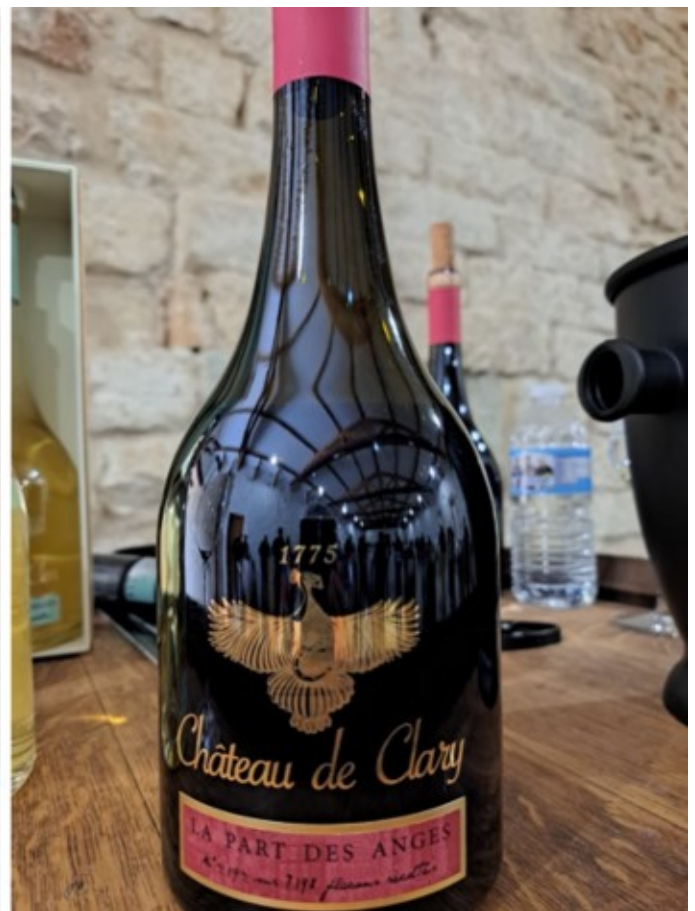
Cyril Chéhovah, du Château Clary à Roquemaure etsa cuvée 'La part des anges'.