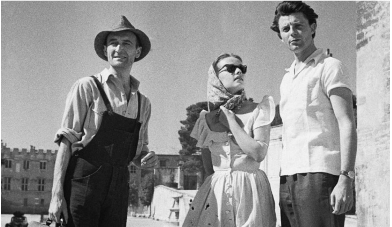
Jean Vilar, Jeanne Moreau et Gérard Philippe sur la place du Palais des Papes devant le Musée du Petit Palais