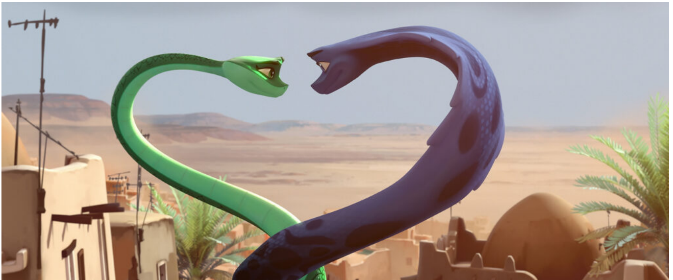
Le long métrage d'animation Sahara est sorti en 2017.