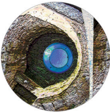
La voix oblique