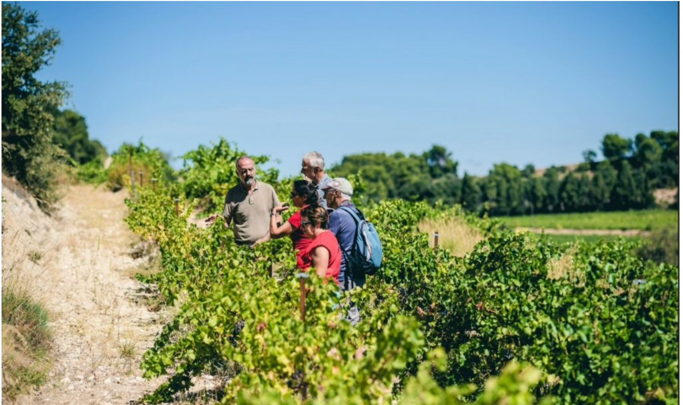
Cultures à flanc de coteaux