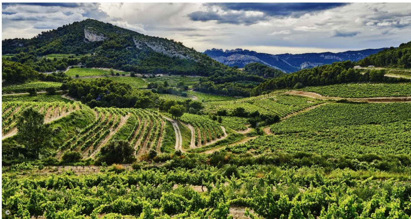
Des paysages Vauclusiens façonnés par l'agriculture