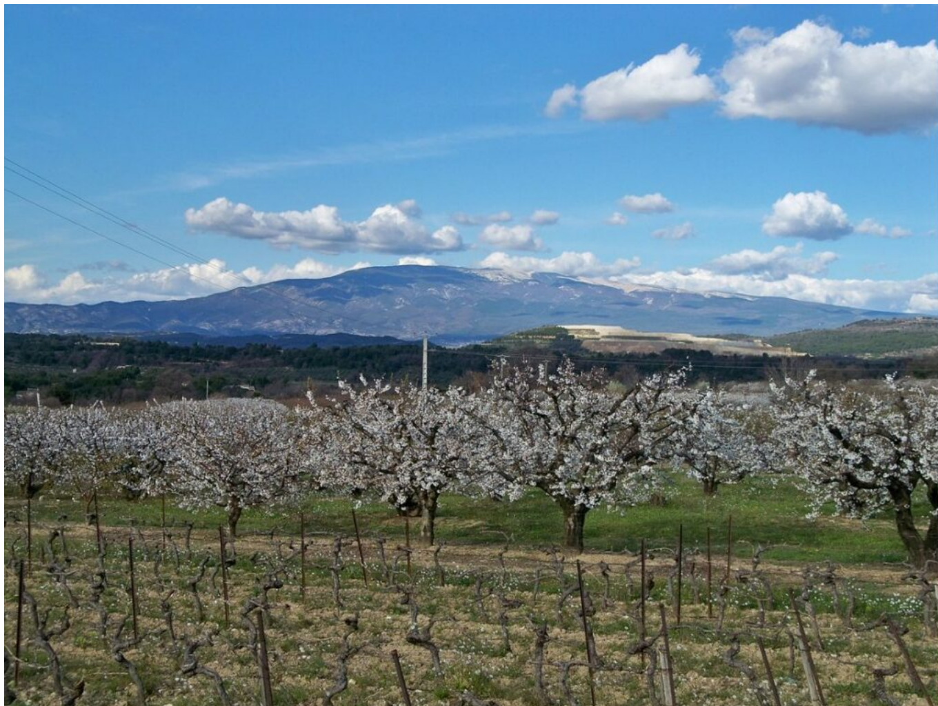
Cerisiers à Venasque