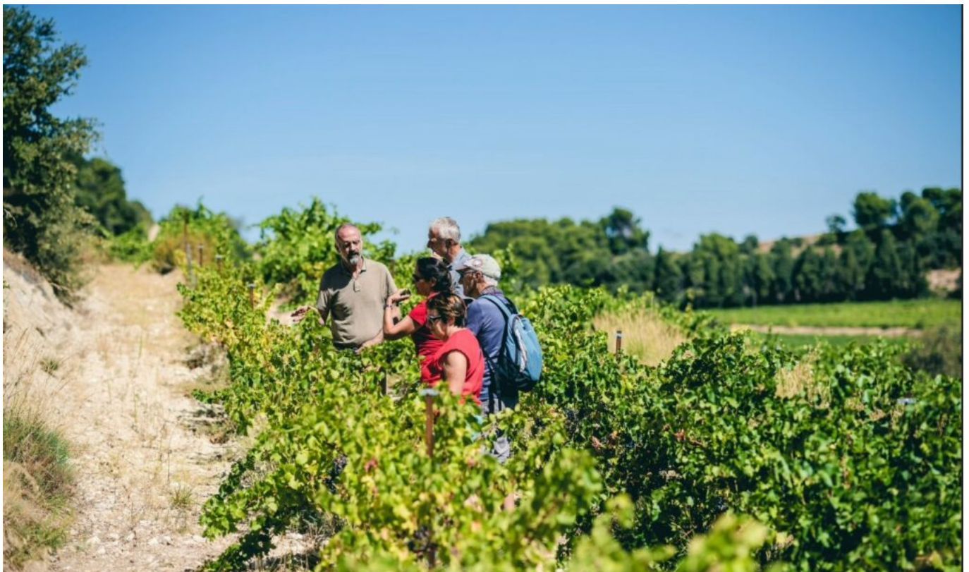
Cultures à flanc de coteaux

«Comme l'urbanisation a grignoté les terres agricoles qui étaient irriguées par les canaux gravitaires autour d'Avignon, d'Orange, de Carpentras, de Cavailon et tous les autres villages, l'agriculture a dû se repositionner sur les hauteurs et, aujourd'hui, avec le changement climatique et d'irrégulières précipitations nous devons désormais arroser sur les coteaux les vignes et les arbres fruitiers, ce qui ne se faisait pas auparavant.»