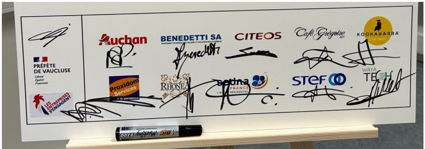
Les 10 nouvelles entreprises signataires de la convention.

Soutenues par l'Etat qui les accompagnent dans cette démarche via notamment la Direction départementale de l'emploi, du travail et des solidarités (DDTES) de Vaucluse, ces entreprises s'engagent à sensibiliser les plus jeunes au monde de l'entreprise afin que ces derniers aient « une meilleure compréhension du monde de l'entreprise, de secteurs d'activité et des métiers d'aujourd'hui et de demain ».