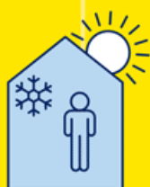
RESTEZ AU FRAIS