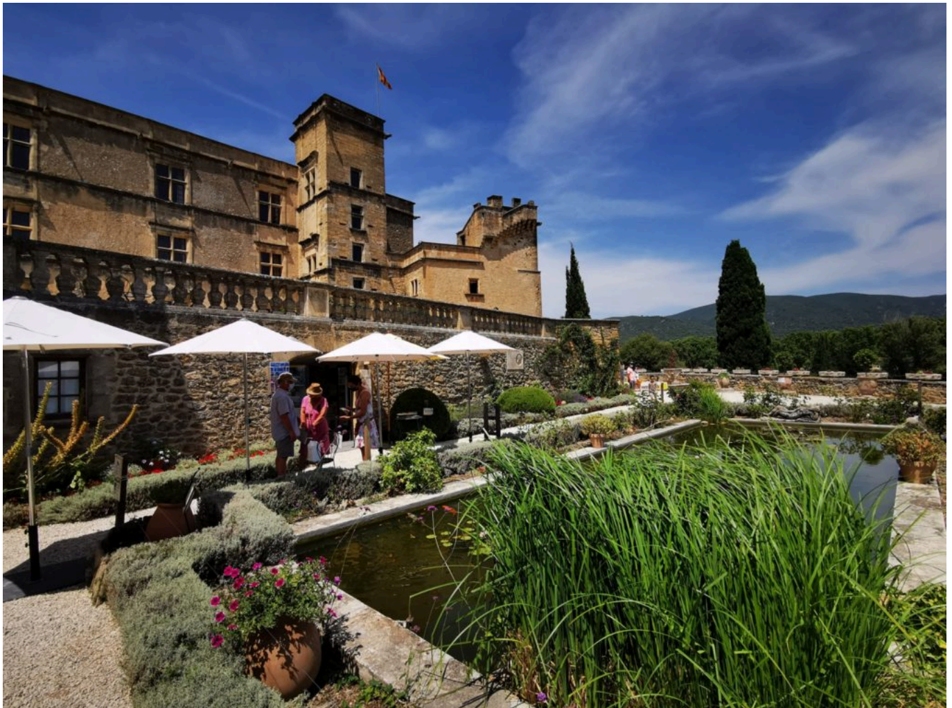
Château de Lourmarin.