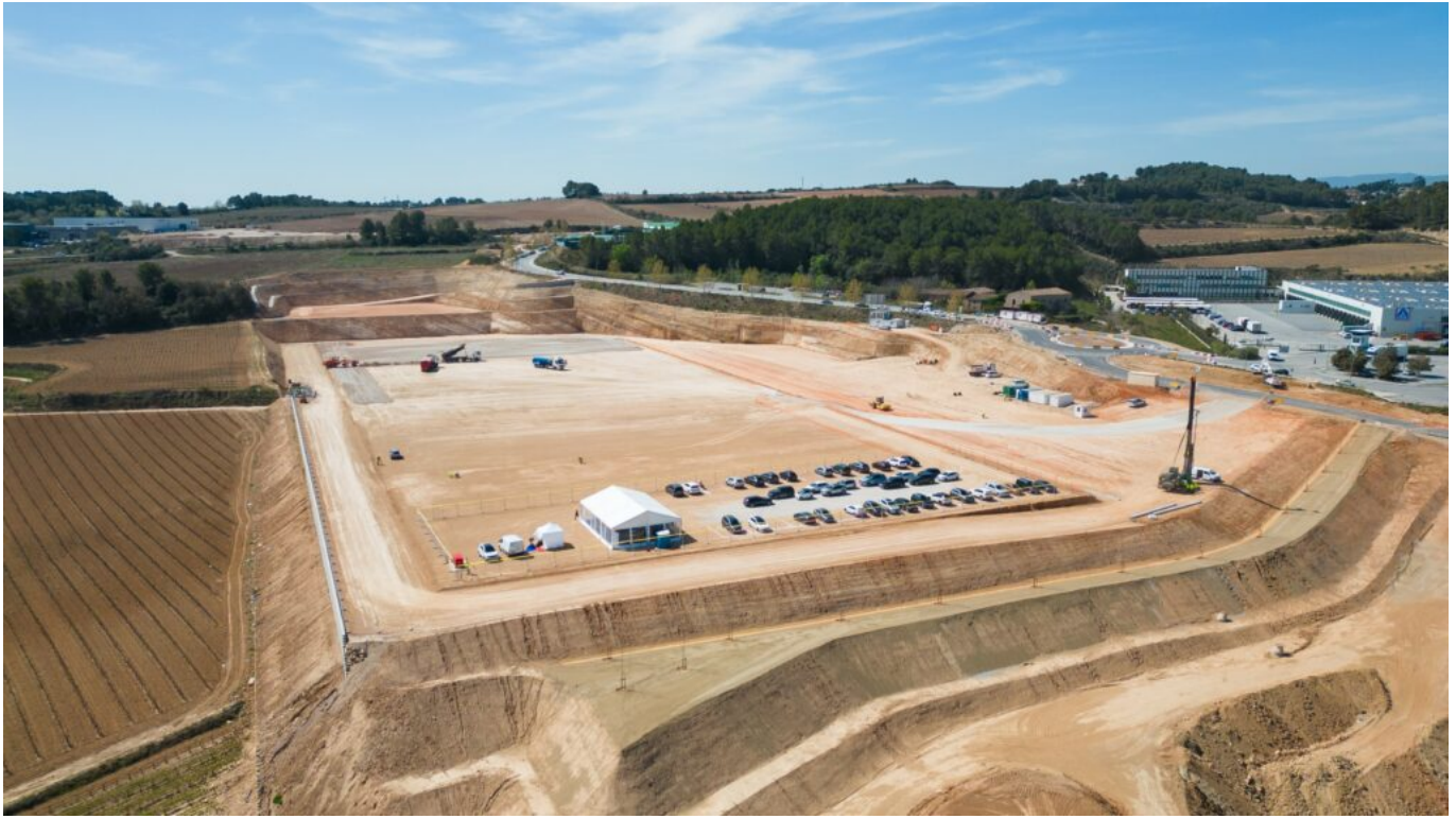
Site du futur ensemble logistique pour GLP à Barcelone