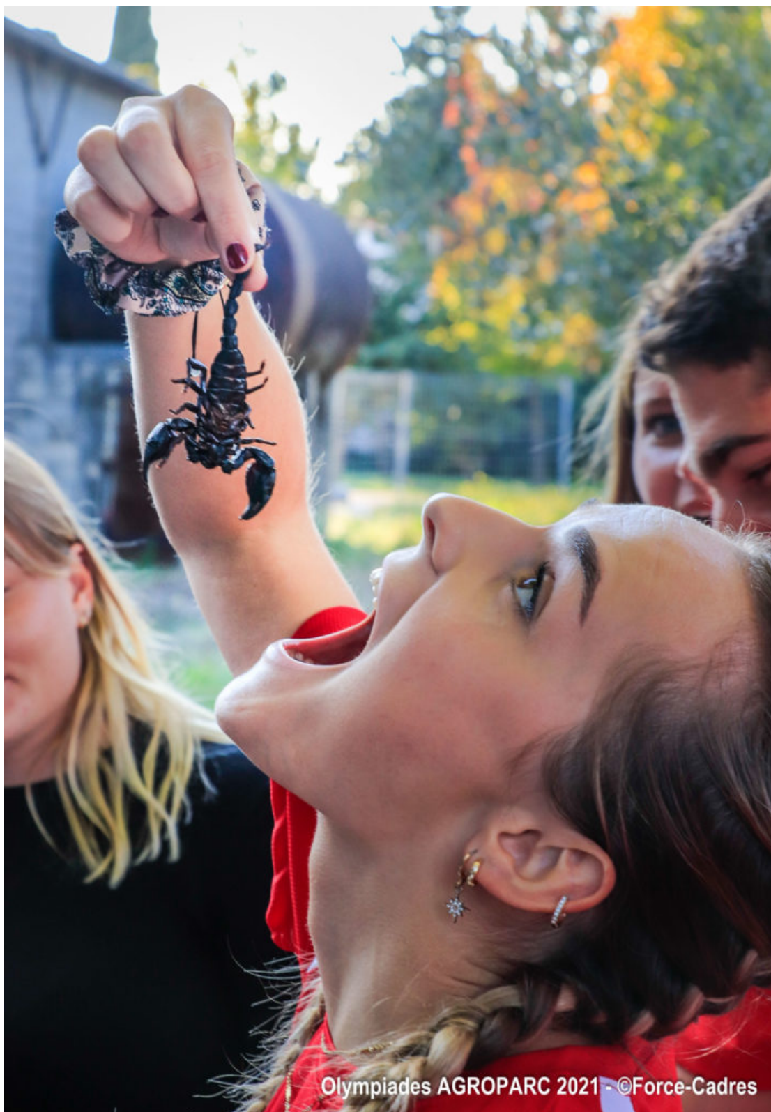
Olympiades AGROPARC 2021