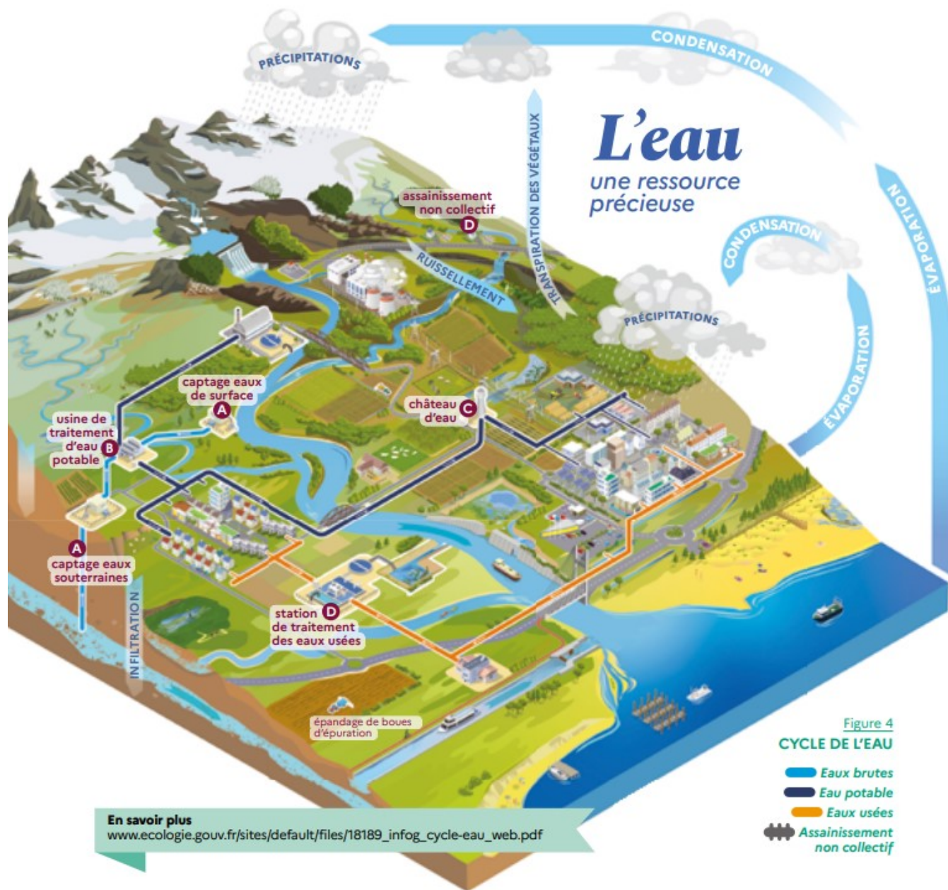
Schéma du cycle de l'eau