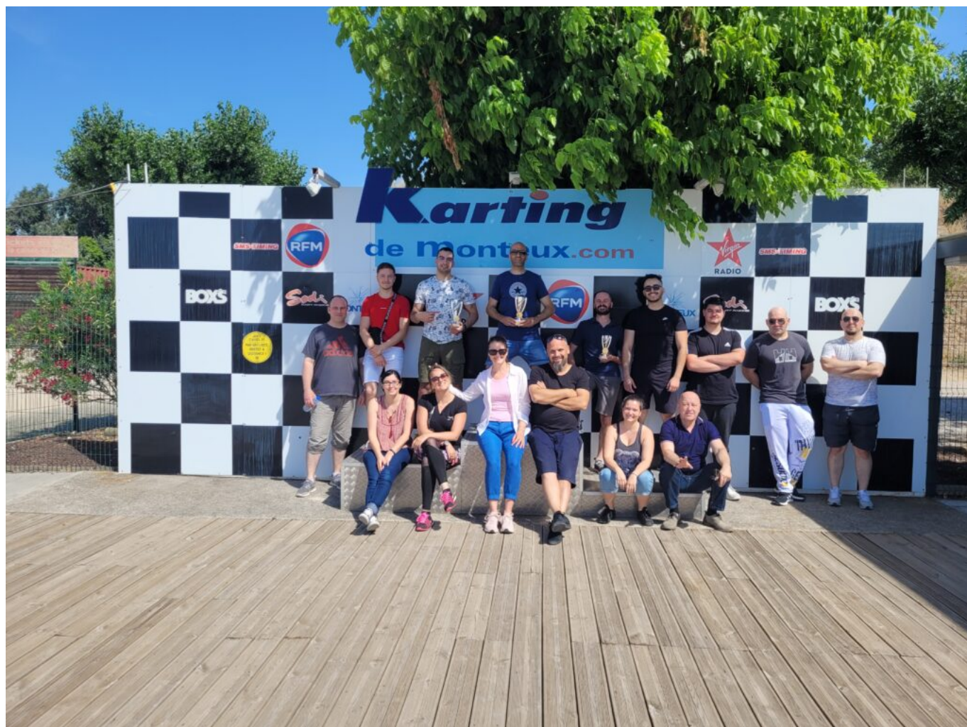
L'équipe lors d'une compétition de karting