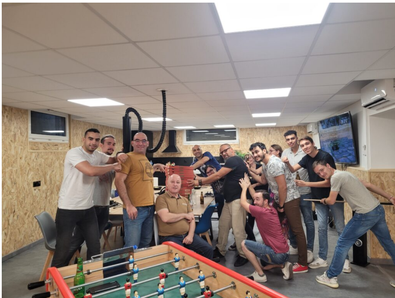
Soirée pizza et jeux