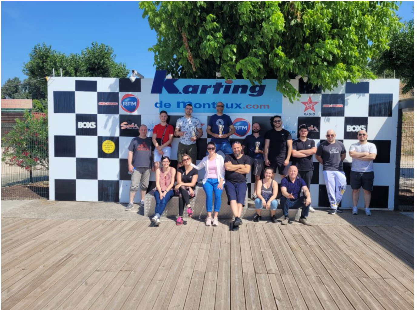
L'équipe lors d'une compétition de karting