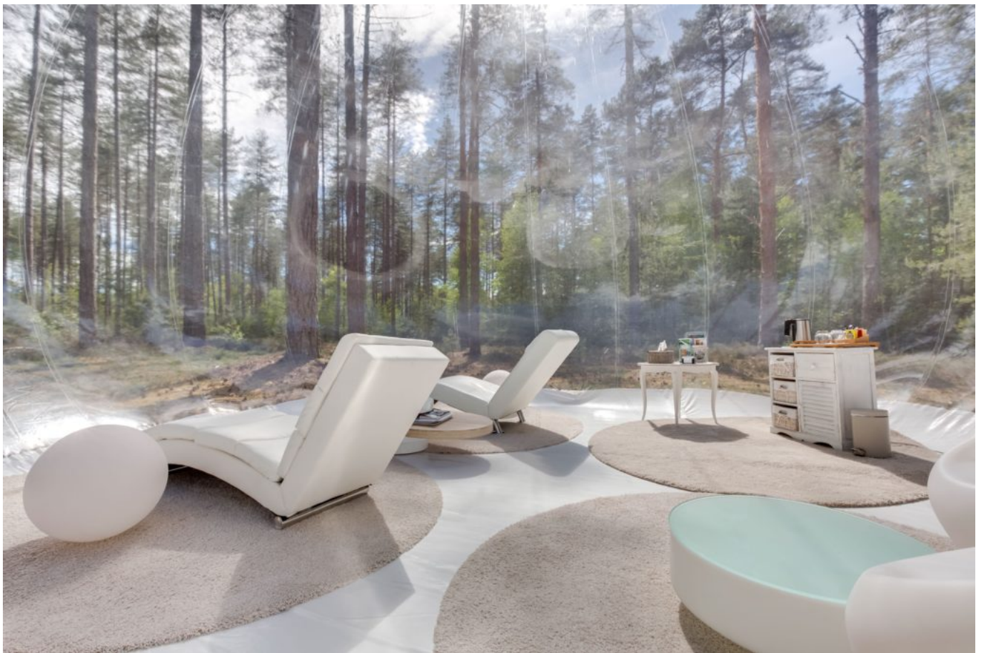
Bulle de cristal