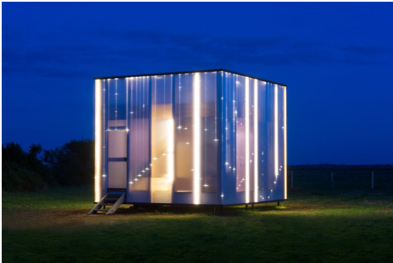
La Bienveilleuse, Lavau-Sur-Loire