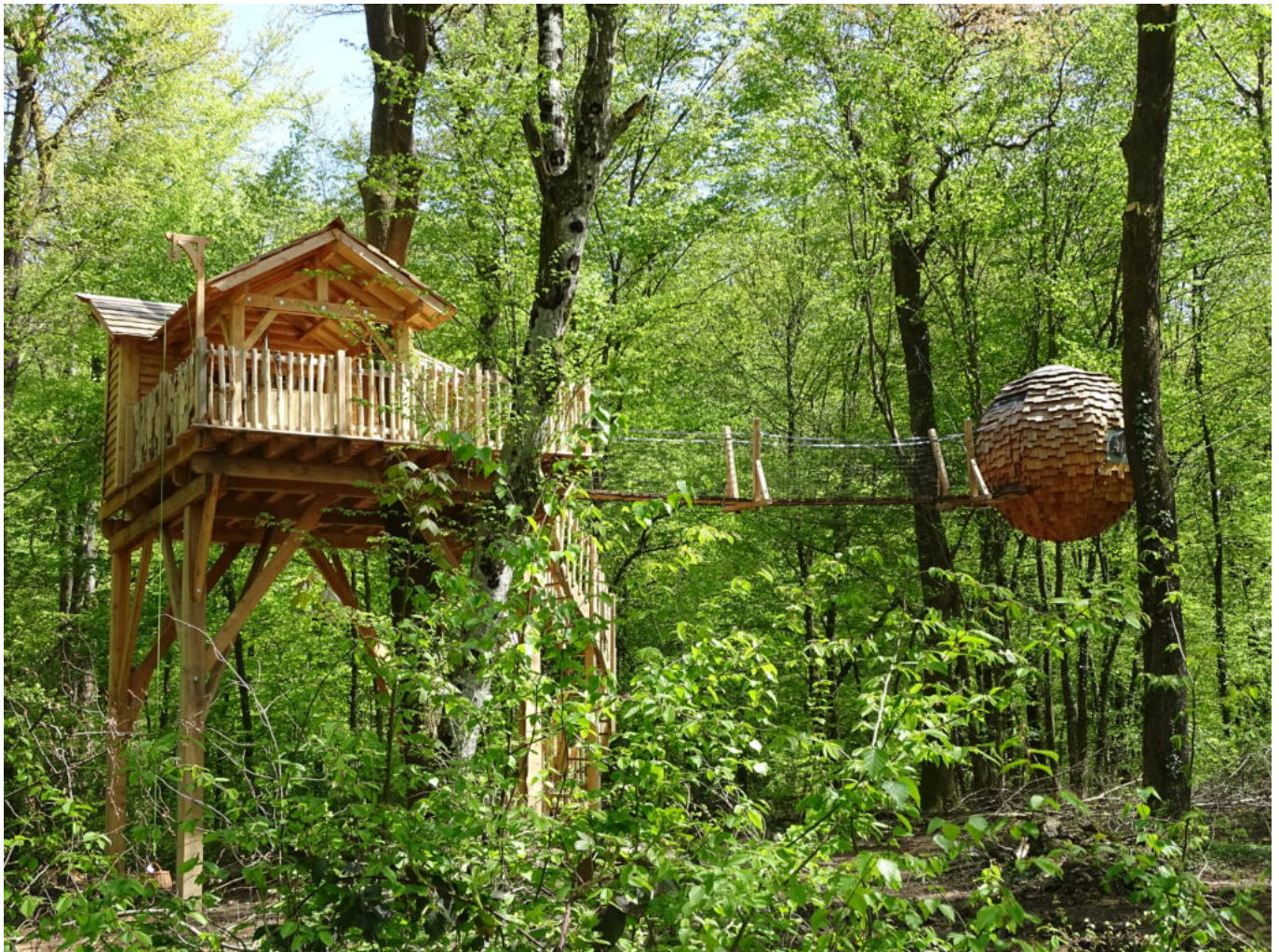
Cabane grands chênes

se lancer dans le vide au bout d'une tyrolienne, ou se laisser flotter au milieu d'un lac. On peut observer les étoiles depuis son lit dans une bulle ou une pyramide de verre. On peut vivre comme un indien le temps d'un séjour dans un tipi, braver le froid dans un igloo, se prendre pour un trappeur dans une cabane en rondins ou encore partir sur les traces de l'anneau dans un trou de Hobbit.