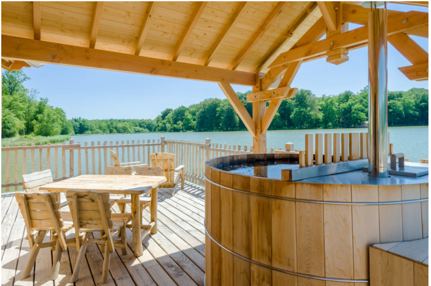
Spa cabane flottante