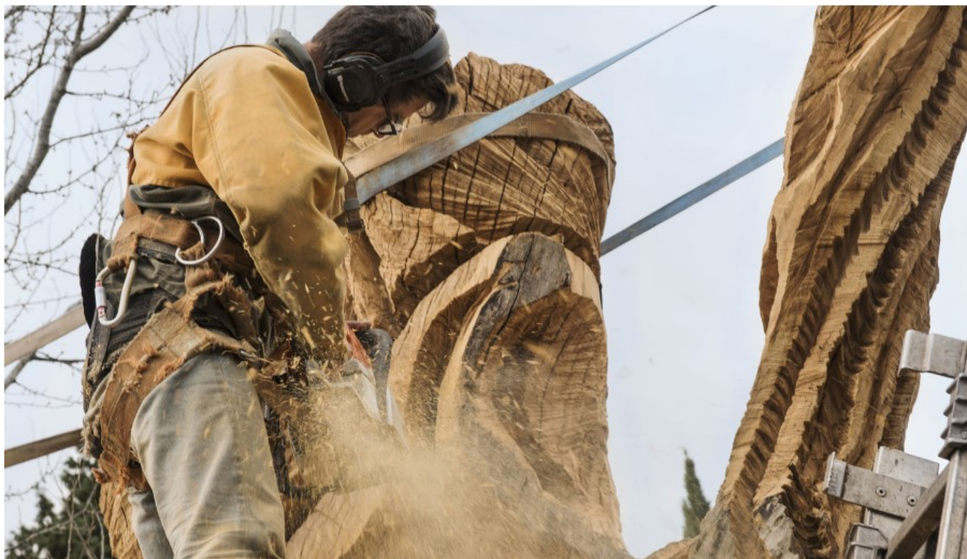
Un homme de l'art