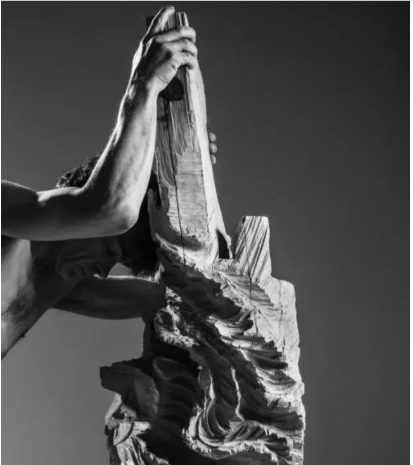
Marc Nucera by Marc Nucera